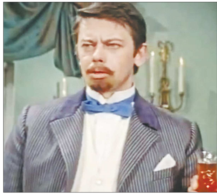
Александр Демьяненко в роли Виктора Бахарева в фильме «Приваловские миллионы», 1972 год