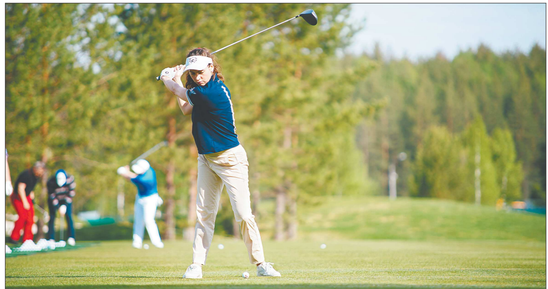
Изя сложной техники в гольфе важна системность занятий – спонтанными набегами в выходные дни результата не добьёшься

Гран-при фестиваля (это вторая по значимости награда) получил француз Робен Кампидо за фильм «120 ударов в минуту».