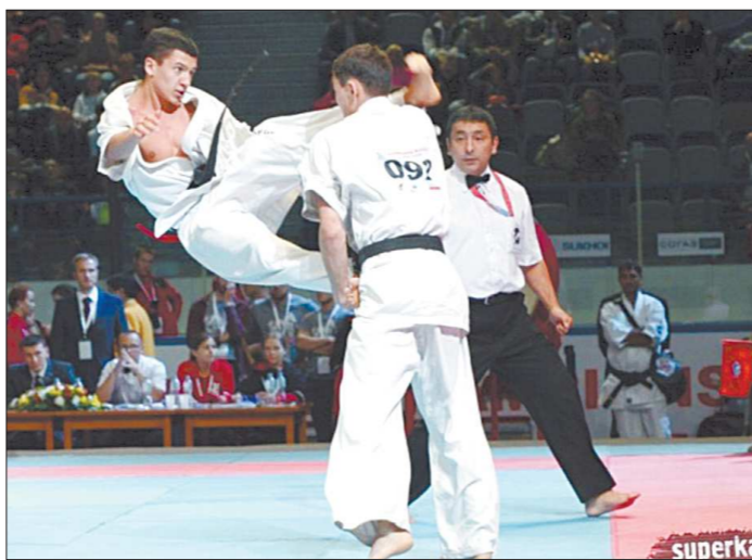
Киокусинкай считается одним из самых трудных и жёстких разновидностей карате