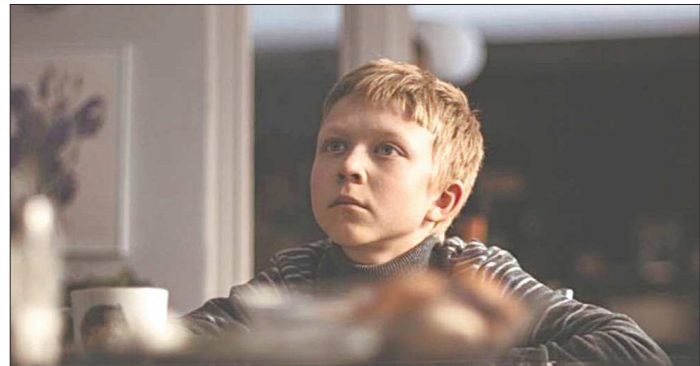
КАДР ИЗ ФИЛЬМА «НЕЛЮБОВЬ». РЕЖ. А. ЗВЯГИНЦЕВ