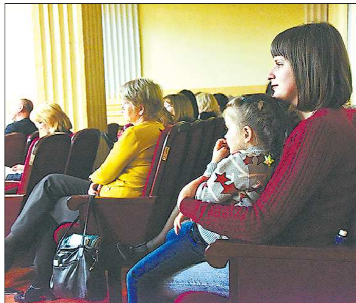
Уже на вторую встречу с Евгением Куйвашевым многие приходят вместе с детьми