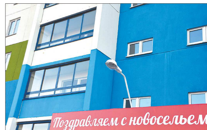
В городах «Большого Екатеринбурга» (Арамиле, Берёзовском, Верхней Пышме и Среднеуральске) предлагается к покупке ещё около 930 квартир.