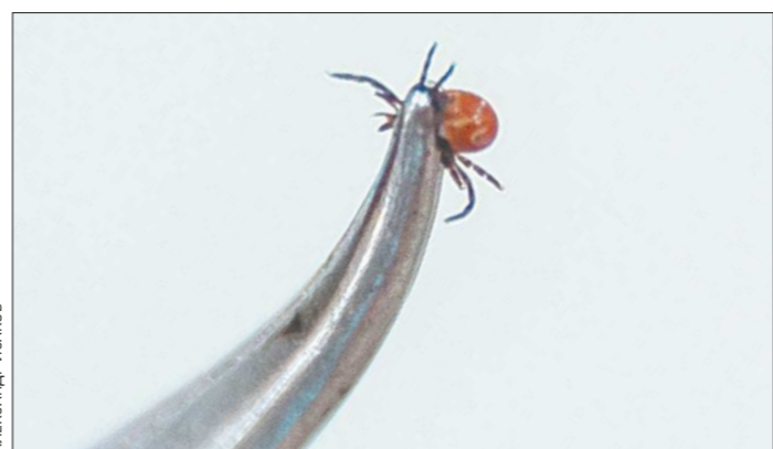
Больше 5 тысяч свердловчан подверглись нападению клещей с начала сезона