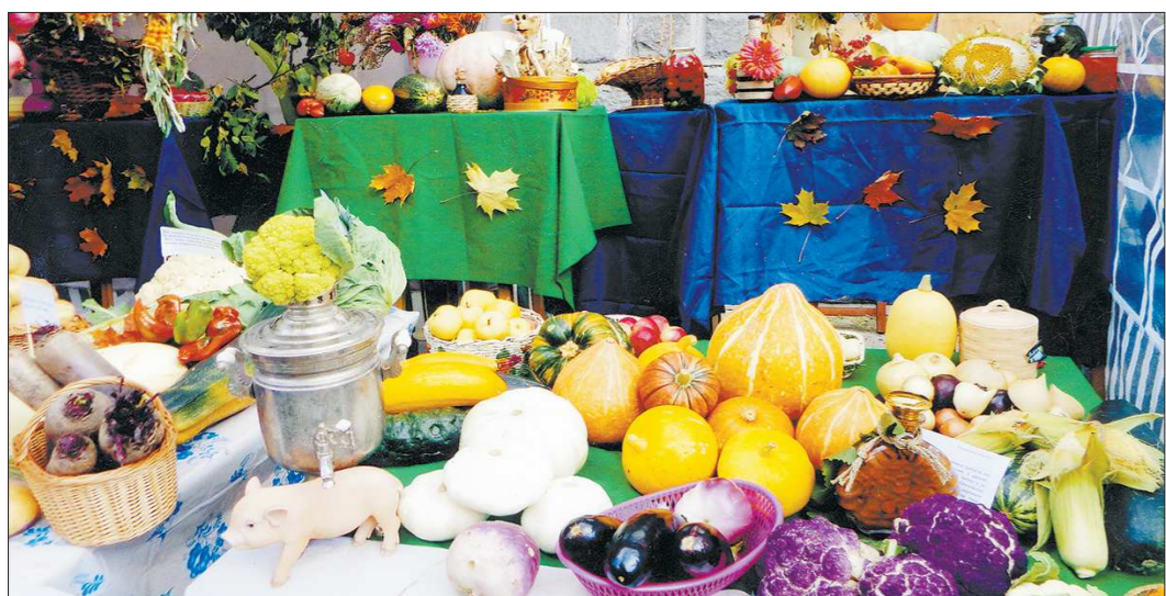
На любой садоводческой выставке тыква и кабачки — неизменный атрибут экспозиции

А вообще надо осторожно относиться ко всяким подкормкам и не вносить лишнее удобрение в готовые грунты. Золотое правило: прежде чем посадить рассаду в грунт, особенно покупной, проверьте: не много ли в нём солей, потому что минеральные удобрения при его изготовлении могут вноситься неравномерно. Кроме того, не всякая покупная земля пригодна для выращивания молодых растений, зачастую производители в упаковках используют старый минерализованный торф, в котором уровень солей зашкаливает. Для проверки грунта на наличие солей существует специальный прибор, которым многие садоводы уже пользуются, — кондуктометр. Действие его основано на принципе электропроводности. А она измеряется в миллисименсах. Измерили, определили, например, что солей много — разбавьте почву торфом или землёй.