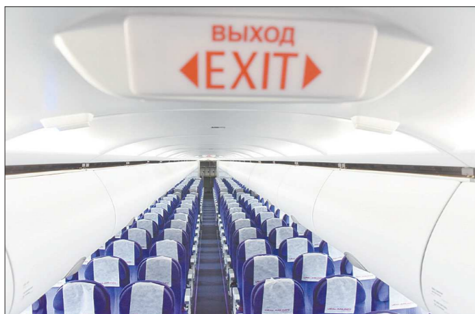
Свердловчан, у которых есть просроченная задолженность на сумму более 10 тысяч рублей, могут развернуть прямо в аэропорту