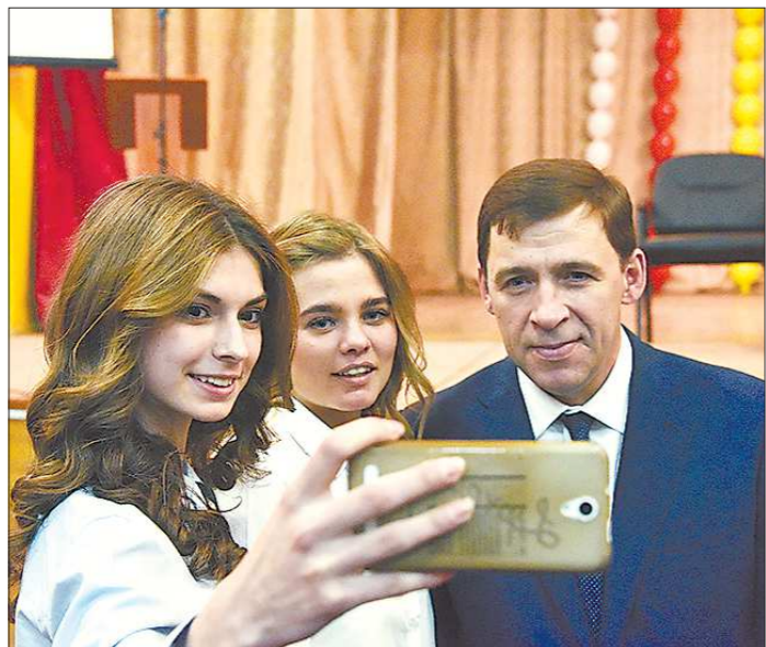
После общения присутствующие окружили главу региона с просьбой сделать селфи

23 мая врио главы региона Евгений Куйвашев провёл вторую встречу с партией «Единой России» в рамках предварительного голосования по подбору кандидата от партии на губернаторские выборы. На этот раз лидер региона общался, как он сам несколько раз повторил, с фундаментом Свердловской области, имея в виду жителей Северного управленческого округа. Они, в свою очередь, продемонстрировали поистине северную закалку и даже не попытались в ходе общения с врио губернатора решить свои частные вопросы: спрашивали преимущественно о глобальном. Ну и немного поиграли в «Поле чудес».