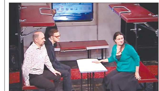
МХТ ИМЕНИ ЧЕХОВА