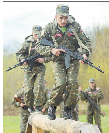
«Шансовцы» на соревнованиях – проходят огневую полосу препятствий

года приказом №25 командующего ВДВ России.