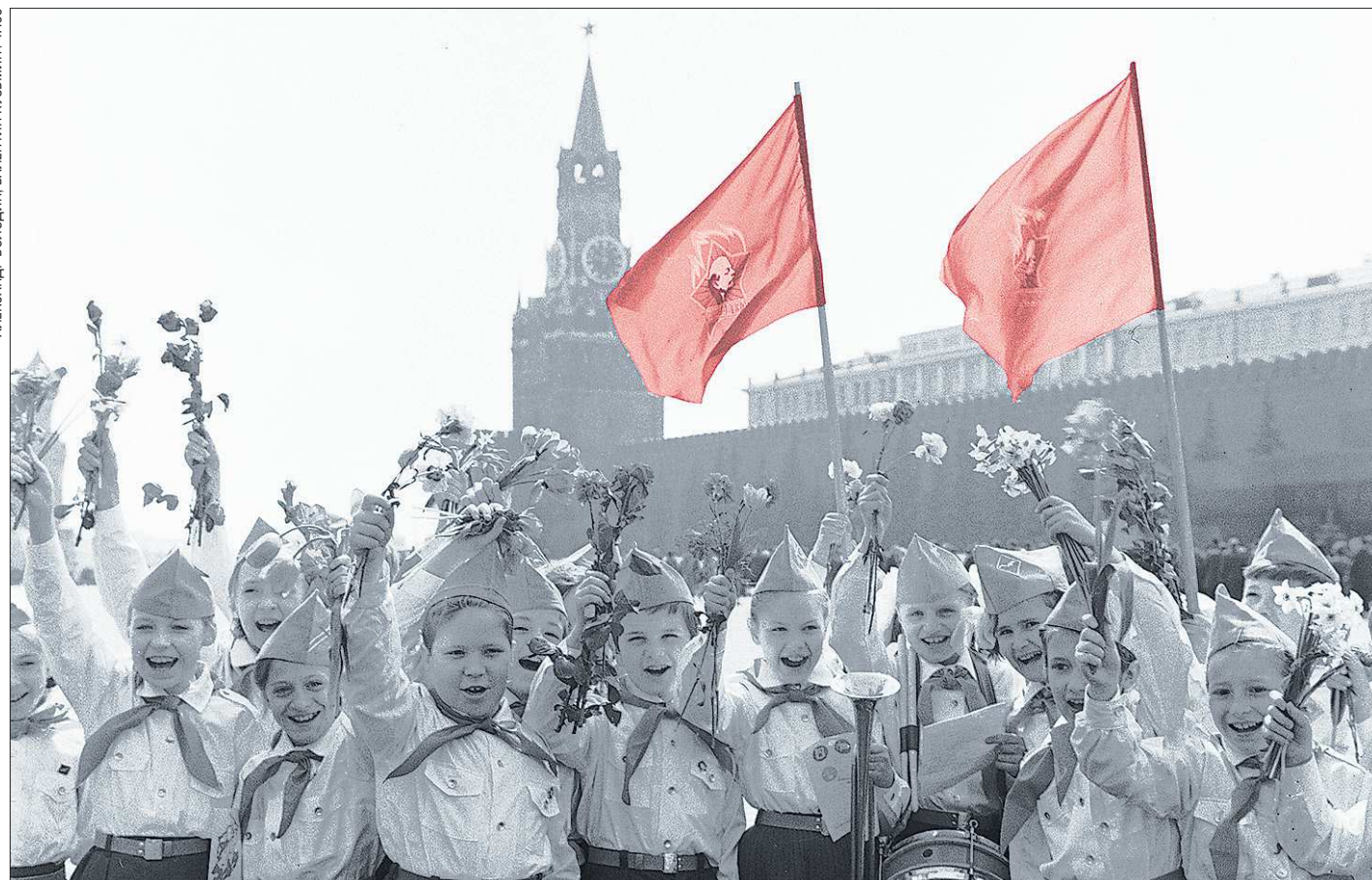
Советские пионеры на Красной площади в Москве. 25 июня 1972 года

Более 15 тысяч школьников готовы возродить в регионе лучшие традиции пионерского движения