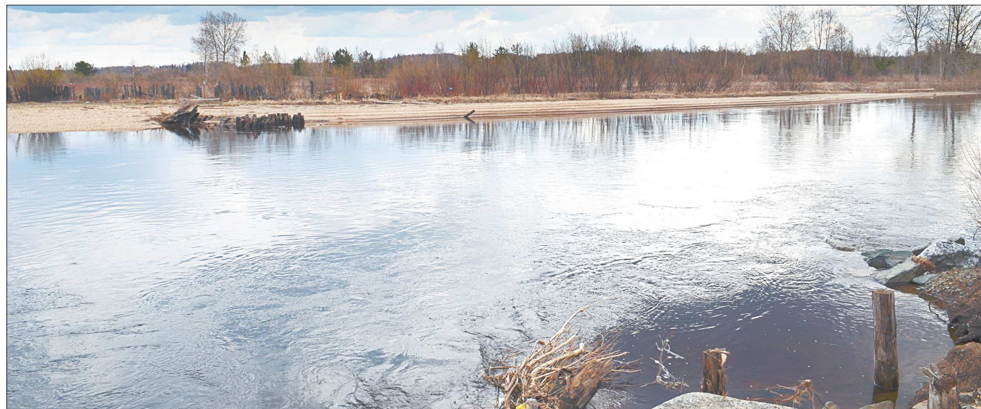
С обрушением моста правый берег опустел

Сейчас о том, что здесь когда-то была переправа, говорят только остатки вбитых свай, что торчат из воды. А ведь совсем ещё недавно мост был гордостью и достопримечательностью микрорайона. Молодёжь удостаивали его своим посещением, туда-сюда сновал народ, переходя с правого берега на левый и наоборот, чтобы пожарить шашлычков, порыбачить, сходить в лесок за ягодами-грибами. Увы, без собственного пла-