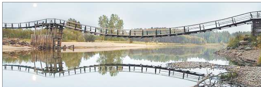
Таким был подвесной мост несколько лет назад. На другой берег ходили порыбачить, за грибами и шишками

Через территорию нашего города протекают две реки, но места отдыха, как это ни странно, у горожан нет. В какой-то период времени ездили отдыхать на затопленные карьеры, устраивали посиделки вдоль берега Ивделя в центральной части города (вода в Ивделе очень холодная, купаются в ней только отдельные смельчаки), ходили на скалы. Все эти места отдыха по разным причинам стали неинтересны, а то и вовсе заброшены. Песчаный берег Лозьвы в районе посёлка Лесозавод был последним