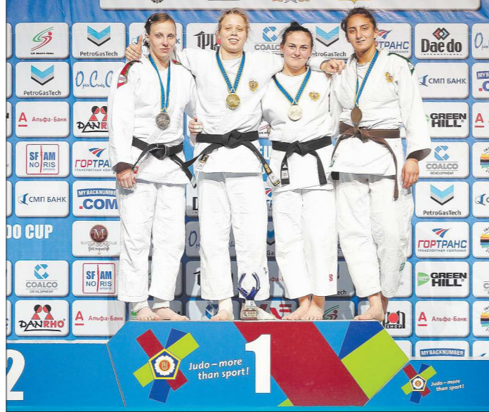
В категории до 63 килограммов у девушек практически весь пьедестал был российским