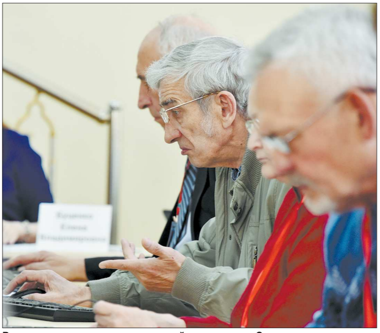
В рамках реализации комплексной программы «Старшее поколение» и ряда других проектов в Свердловской области за последние несколько лет компьютерной грамотности обучились около 48 тысяч пенсионеров