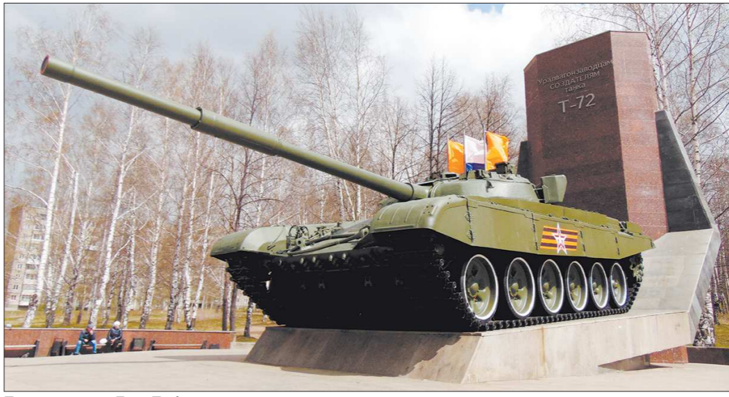
По традиции к Дню Победы тагильские танки-памятники моют и чистят, к счастью, происшествие не отразилось на внешнем облике Т-72

Полицейские считают, что, скорее всего, пожар случился, когда брошенный окуроч попал на скопившийся в