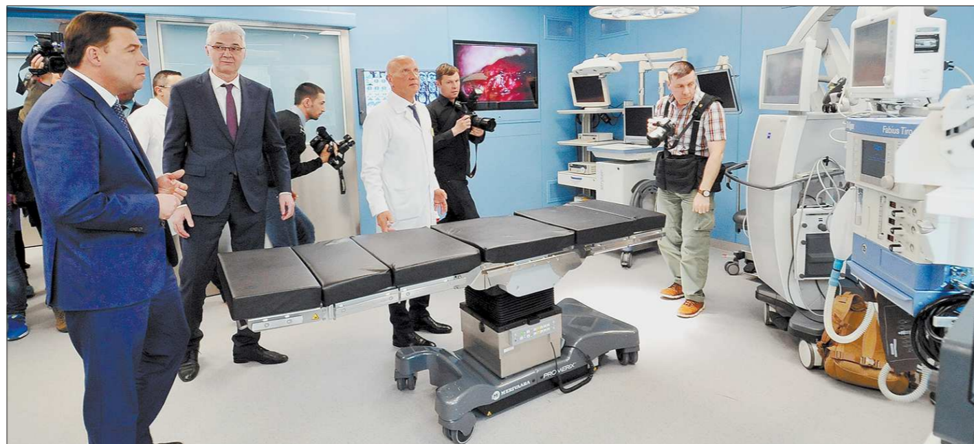
Врио губернатора Евгений Куйвашев (слева) и сити-менеджер Екатеринбурга Александр Якоб убедились, что обновлённые операционные нейрохирургического корпуса ГКБ № 40 теперь оснащены самой современной техникой

Ключевые компетенции в градостроительной политике Екатеринбурга, согласно закону, по-прежнему останутся у области. Речь идёт об утверждении нового генплана Екатеринбурга и нормативов градостроительного проектирования, которые действуют в городе. Выдача разрешений на строительство каждого конкретного объекта также останется за областным министерством.