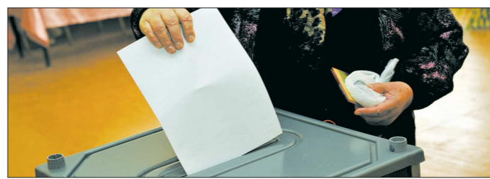
Чтобы проголосовать далеко от места прописки, открепительное удостоверение не понадобится

— После модернизации операционного блока нейрохирургического корпуса ГКБ № 40 доступность высокотехнологической медицины для жителей региона станет выше, — заявил во время посещения медицинского учреждения врио губернатора Свердловской области Евгений Куйвашев. — Ремонт и переснащение операционных позволит увеличить количество хирургических вмешательств на 20 процентов. Это значит, что люди смогут получать медицинскую помощь необходимого уровня именно тогда, когда она им будет нужна.