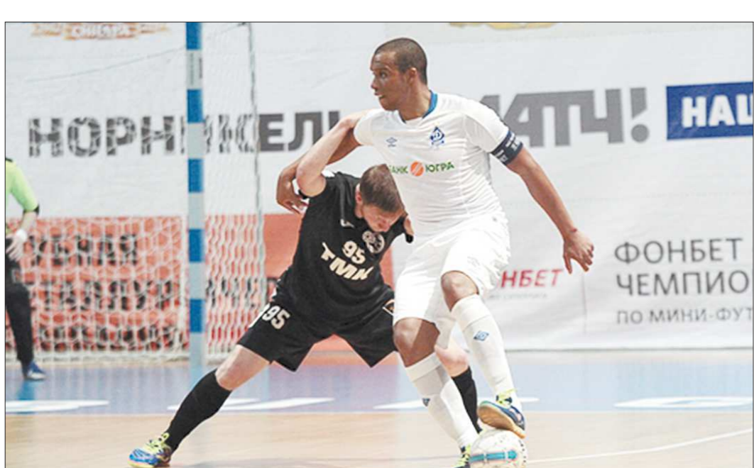
В матчах с «Динамо» игроки «Синары» упорались до самого конца

Окончательная заявка национальной сборной на Кубок Конфедераций должна быть обнародована не позднее 7 июня.