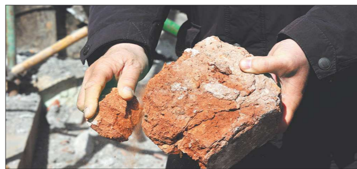
Старинный кирпич крошится прямо в руках