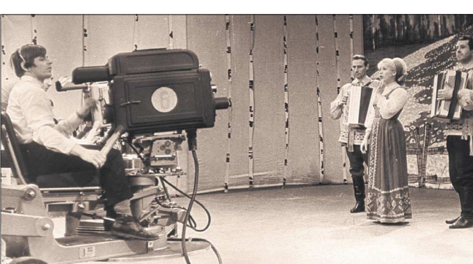
1969 г. Одно из первых, ещё в самодеятельности, выступлений на ТВ (г. Челябинск). Технические возможности у телевидения было меньше, зато искреннего интереса и уважения к народному искусству — несравнимо больше

— Фраза, которая поддерживает вас в трудных ситуациях? — «Всё проходит. Пройдёт и это...»