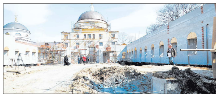
Церковь Введения во храм Пресвятой Богородицы

— Успенский храм — сердце Ново-Тихвинского монастыря, — объясняет старшая сестра церковно-исторического послушания Евстафия. — Здесь обитель начиналась в 1809 году, и восстановление храма много значит для нас. Сейчас стены поставлены уже по всему периметру, исторические формы здания сохранили. Храм-памятник, перестроенный в советское время до неузнаваемости и наполовину разрушившийся, теперь принимает первоначальный вид. Реконструкция храмов Ново-Тихвинского монастыря идёт уже примерно 20 лет, с момента его возрождения в 1994 году. Первым реставрировали храм Александра Невского — в 2013 году его освятил Патриарх Московский и всея Руси Кирилл. Монахиня Фессалоника, насельница Ново-Тихвинского монастыря, рассказывает, что его восстановление длилось пять лет. Сколько потребуется на восстановление Успенского — пока неизвестно, за скоростью здесь не гонятся.