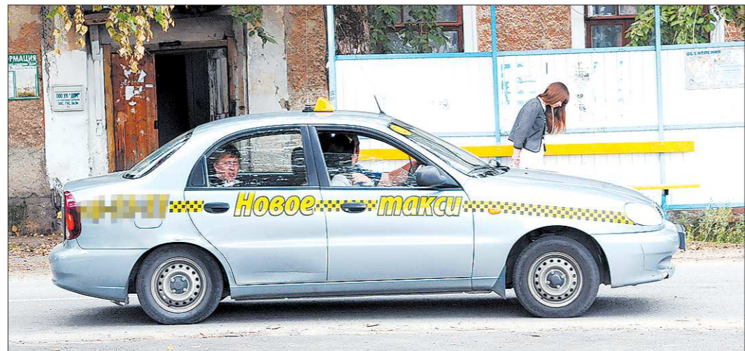
Вызов такси по телефону — сегодня уже прошлый век. Сегодня для этой цели существуют десятки мобильных приложений