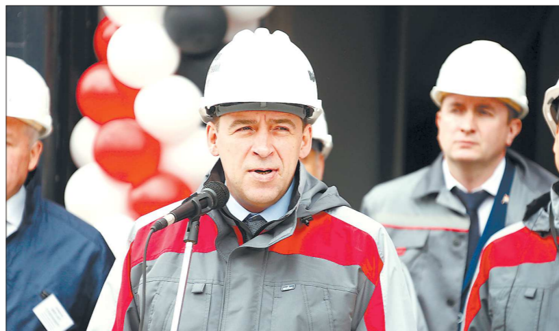
Глава региона Евгений Куйвашев отметил, что сегодня УАЗ — это конкурентоспособное предприятие с высокотехнологичным производством

Но это исключение из правил. Обычно же происходит так, как было на выборах в Кушвинскую думу в прошлом году. В тех выборах приняли участие 12 иногородних кандидатов. Большинство приехавших кандидатов оказались к тому же безработными. Такому списку в библиотечках кушвинцы были обязаны Новоуральскому крылу ЛДПР. Однако утешиться в Кушве не удалось ни одному из зачётных соколов Жириновского .