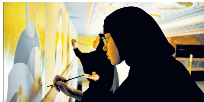
Сёстры расписывают стены храма