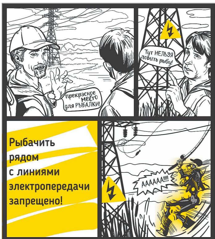
Рыбалка возле линий электропередачи смертельно опасна. Удочка является хорошим проводником. На тот свет