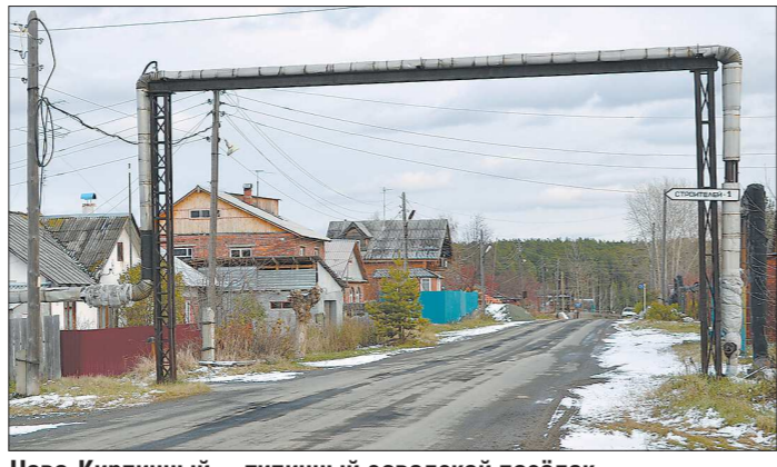
Ново-Кирпичный — типичный заводской посёлок

Асбест не только лишился более трёхсот рабочих мест, что для моногорода болезненно, — накануне зимнего сезона в прошлом году остались без источников отопления и горячей воды жители Ново-Кирпичного. Люди неоднократно обращались в городскую администрацию, в редакцию «Асбестовского рабо-