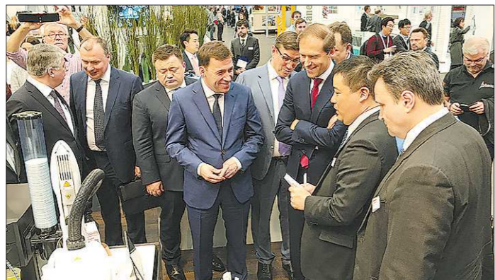
Помимо участия в переговорном процессе Евгений Куйвашев вместе с министром промышленности и торговли РФ Денисом Мантуровым совершил обход выставки