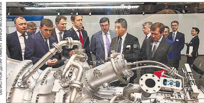
Ганноверская промышленная ярмарка отражает тенденции мировой экономики, подчёркивая значимость таких направлений, как ИТ, промышленная автоматизация, энергосбережение, экологическая ответственность, исследования и инновации

са стран Европейского союза, США, Японии, Южной Кореи и Турции, а также Европейской ассоциации свободной торговли. Именно это объединение европейских предпринимателей министр иностранных дел России Сергей Лавров в своё время назвал эффективным механизмом в условиях временных противоречий между Россией и Европой при осуществлении технологического партнёрства.