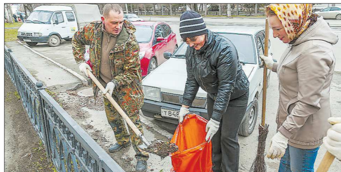
Вчера на уборку вышли сотрудники тагильской мэрии. Креатив это, конечно, хорошо, но главное в субботнике — погода

● ПЕРВОУРАЛЬСК. В этом году администрация Первоуральска предложила объединиться всем участникам субботников в социальные сети под хэштегом #ЧИСТЫЙПЕРВОУРАЛЬСК. Участники фотографируются во время уборки города и размещают снимки в соцсетях. Так первоуральцы получили возможность обсудить субботник мэрии, прошедший в пар-