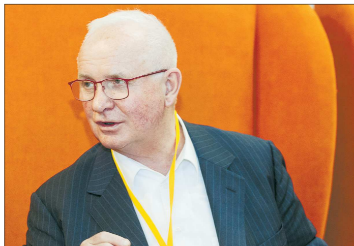
Ян Кампбелл — один из немногих западных обозревателей, которому правительство РФ заказывает анализ влияния мировых событий на нашу экономику

— Индия и Китай важны России в плане рынков сбыта. В России демография небольшая — чуть более 140 миллионов людей, в то время как в Китае и Индии — 2–3 миллиарда людей, которые способны купить продукцию страны. В то же время та конкурентная и высокотехнологичная продукция, которая сегодня производится в Китае и Индии, не всегда до-