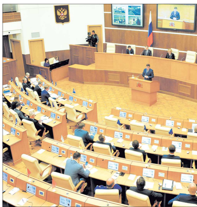
Депутаты Законодательного собрания одобрили отчёт губернатора Евгения Куйвашева о работе правительства и поддержали установки, которые он дал на предстоящие пять лет

Совмещая современную промышленную политику и стратегии территориального развития, мы должны создать новую экономиче-