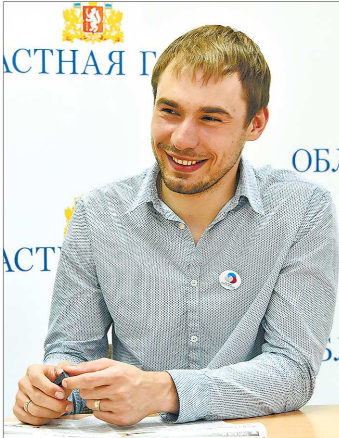
Надеемся, что в следующий раз Антон Шипулин придёт в редакцию «ОГ» уже с золотой медалью Игр в Пхёнчхане