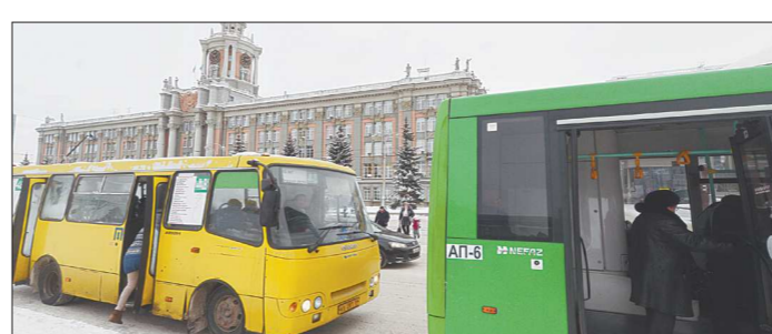
Скоро екатеринбуржцам придётся использовать альтернативу привычным автобусным маршрутам

О раскрытии информации субъектом рынков электрической энергии ООО «Энергоснабжающая компания» (юридический адрес: 620012, г. Екатеринбург, площадь Первой Пятилетки, ИНН 6673092454, КПП 668601001, ОКПО 59285765, ОГРН 1026605613011) на основании постановления Правительства РФ от 21 января 2004 г. № 24.