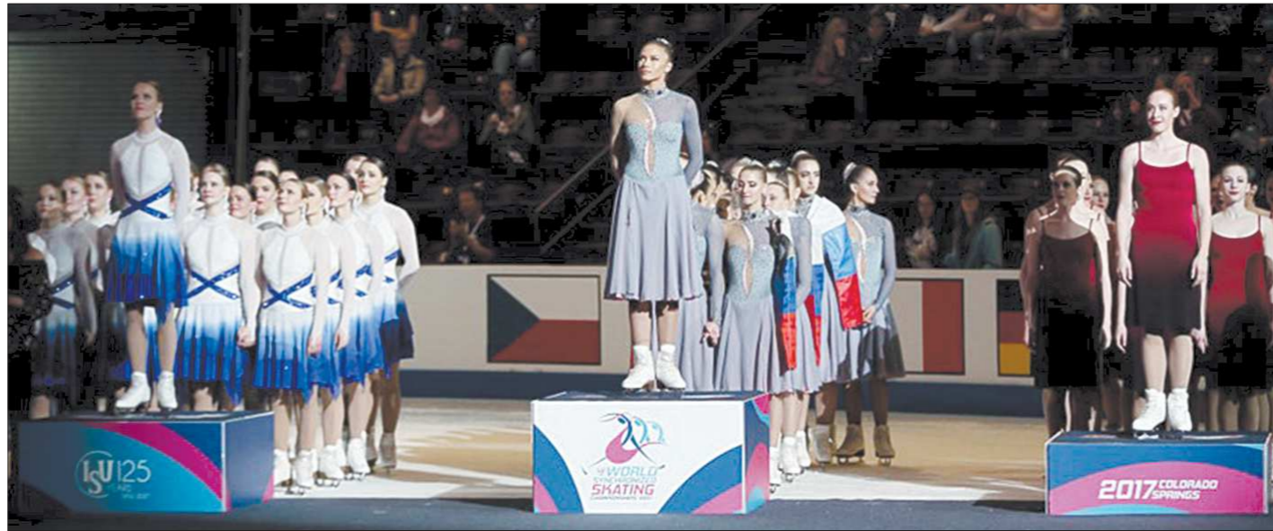
Фигуристки «Парадиза» стали чемпионками мира второй год подряд. Второе место заняла финская команда Marigold IceUnity, замкнули тройку призёров представительницы канадской команды Nexixе