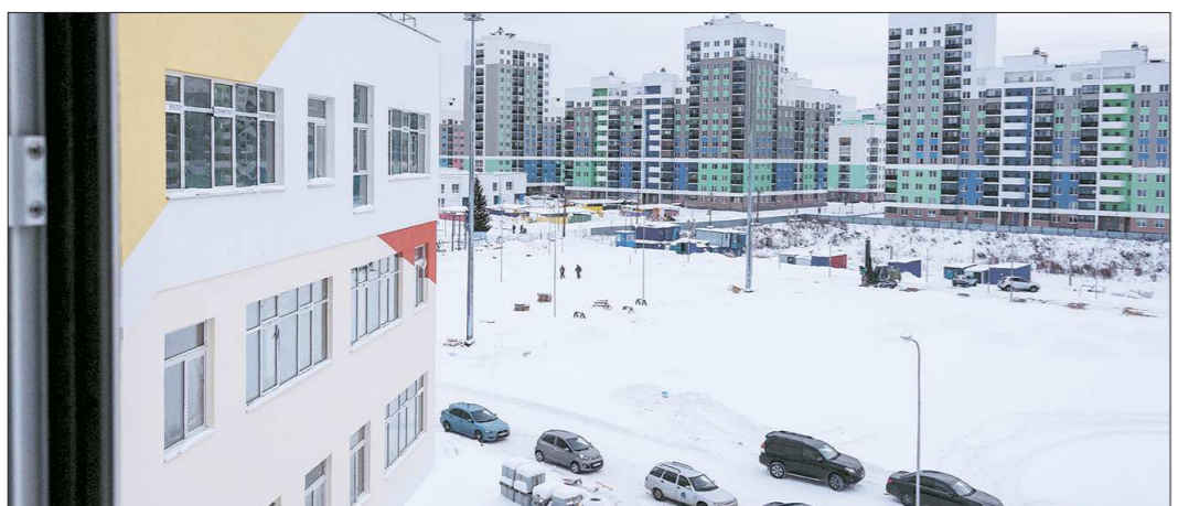
Сейчас строительство Академического на 70 процентов финансируется из федерального бюджета, на 25 процентов — из областного бюджета, на 5 процентов — из городского

— Можно вернуть 13 процентов от сделанных пожертвований, которые были направлены религиозным и социально ориентированным некоммерческим организациям, осуществляющим деятельность в области науки, культуры, спорта (за исключением профессионального), образования, здравоохранения, защиты прав человека, охраны окружающей среды, защиты животных, защиты граждан от чрезвычайных ситуаций. Для получения вычета надо предоставить договор пожертвования, платёжные документы (банковское поручение или кассовый ордер), копию устава организации-получателя пожертвования. Максимальная сумма расходов, которую вы можете использовать для вычета, ограничена 25% суммы вашего годового дохода.