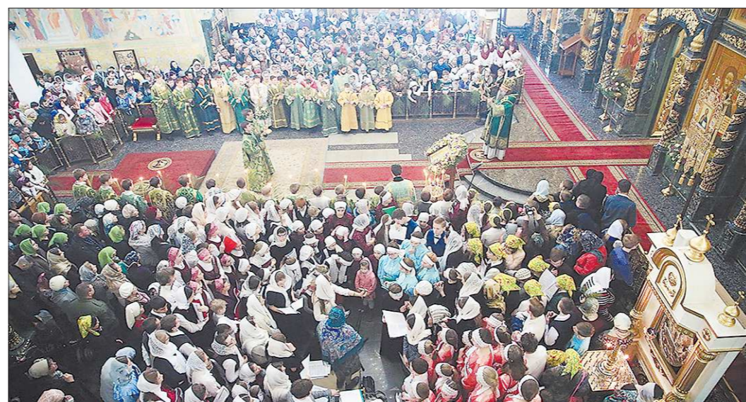
В воскресенье на архиерейскую литургию в Свято-Троицком кафедральном соборе Екатеринбурга собрались тысячи прихожан вместе с детьми из воскресных школ