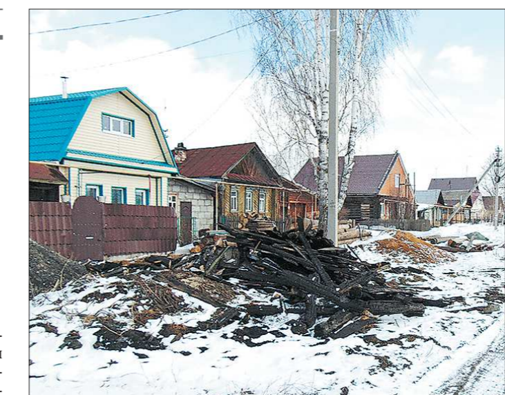
Улица Колхозная в Николо-Павловском ждёт генеральной уборки