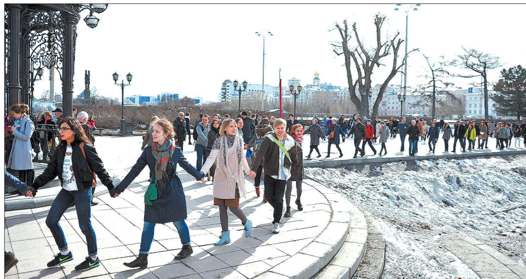
Из соцсетей, в которых приглашали поучаствовать в акции, люди вышли на набережную пруда, чтобы пообщаться вживую

вославных храмов, что уж говорить обо всём регионе. Во многих из них и утром, и вечером во время службы места для всех прихожан не хватало — люди стояли на ступенях, и во дворах церквей. Из-за переполненности храмов многие не стояли всю службу, а лишь освящали вербы и затем уходили домой, так что, очень вероятно: через храмы в Свердловской области в минувшее воскресенье прошло ещё больше людей, чем по подсчётам митрополии.