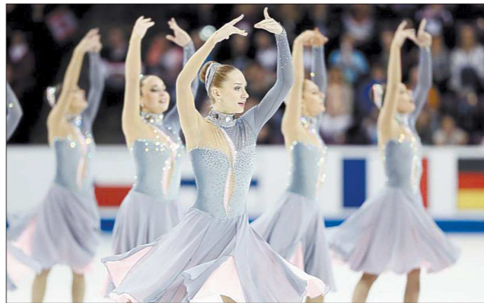
Россиянки, несмотря на менее сложную произвольную программу, чем у соперниц, сумели завоевать золотые медали благодаря качеству выполненных элементов

В американском городе Колорадо-Спрингс завершился чемпионат мира по синхронному катанию. В соревнованиях приняли участие 24 команды из 19 стран мира, а титул сильнейшего коллектива завоевала российская команда «Парадиз».