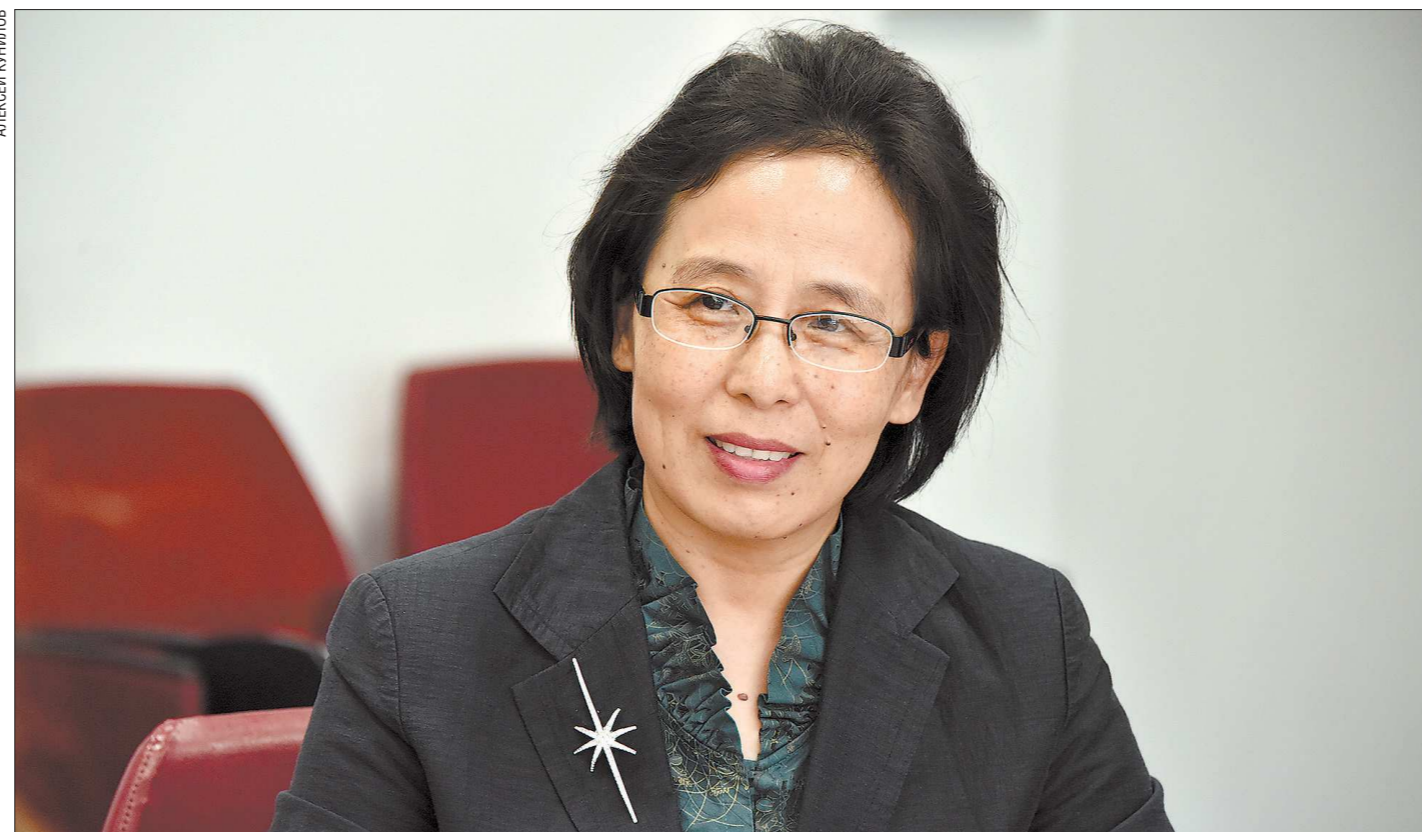
Госпожа Гэн Липин вступила в должность генконсула Китая в Екатеринбурге полгода назад

30 марта в Екатеринбурге прошёл форум «Содействие торгово-экономическому сотрудничеству между Китаем и Россией на Урале», организованный Генконсульством Китая в Екатеринбурге. Здесь представители регионов УрФО рассказали китайским партнёрам о возможностях для инвестирования и обсудили с ними способы укрепления отношений между странами