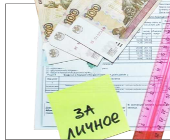
Плата за общедомовые нужды иногда в разы превышает личные