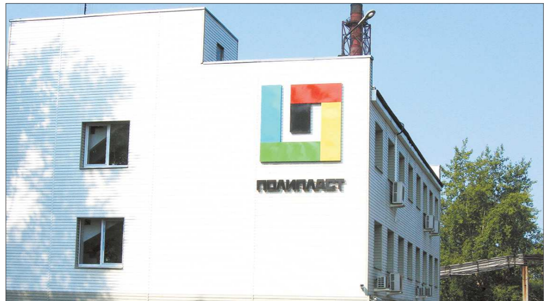
«Полипласт — УралСиб» пригласил участников общественной инспекции вновь посетить предприятие в конце 2017 года