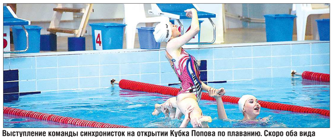
Выступление команды синхронисток на открытии Кубка Попова по плаванию. Скоро оба вида спорта будут жить под одной крышей