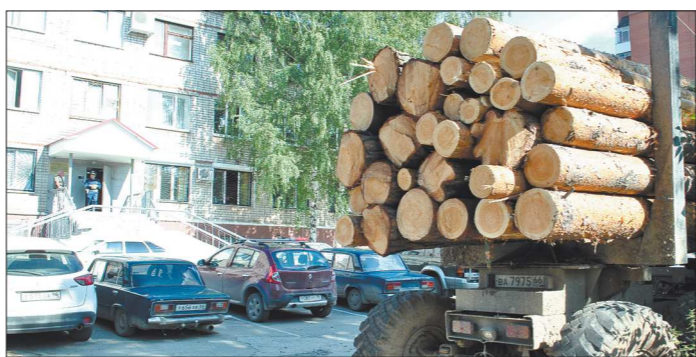
Задержанные лесовозы возле полиции – привычное дело

Но ситуация начала меняться: в декабре прошлого года на совместном совещании с природоохранной прокуратурой было подписано соглашение о взаимодействии в борьбе с незаконной рубкой лесов. – Сегодня нас поддерживает прокуратура, полиция, ОБЭП, и результаты уже налицо: каждую неделю ловим чёр-