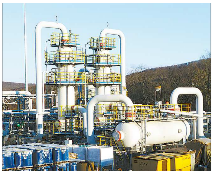
Монтаж оборудования на КС «Краснодарская»

В последние годы большая часть готового оборудования предназначается для предприятий нефтегазового комплекса. Но и своих традиционных потребителей — предприятий химической отрасли — завод не забывает: в этом году снова заключён контракт на изготовление оборудования для АО «Апатит», крупнейшего производителя минеральных удобрений. «Уралхимаш», как и раньше, держит планку на высоте. Завод работает над крупными заказами, постоянно берёт новые рубежи — квалифицированный персонал, обновлённые основные фонды, наличие различных аттестаций (ISO, ASME, CTO Газпром) позволяют конкурентоспособность предприятия на рынке и позволяют с уверенностью смотреть в будущее.