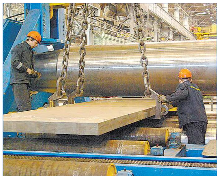
Вальцовка толстолистовых обечайек