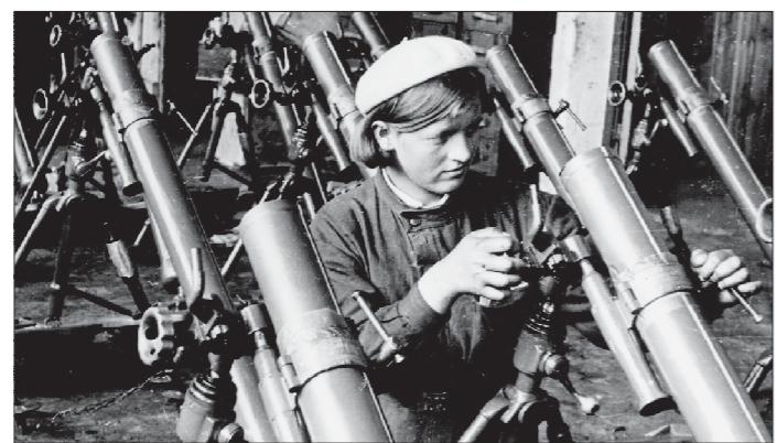
Полковые миномёты, 1942 год

Решение о строительстве машиностроительного завода, который бы обеспечивал необходимым оборудованием предприятия химической промышленности, было принято в 1930 году. Но стройка шла ни шагу ни валько, так что к 1941 году на строительной площадке были только гараж и расчищенная площадка с подъездной грунтовой дорогой. После начала войны, когда было принято решение об эвакуации промышленных предприятий с западных территорий нашей страны, большая часть из них направлялась на Урал и в Сибирь. Киевский завод «Большевик» был эвакуирован в Свердловск, на площадку будущего Уралхимаша. Киевляне, прибывшие 6 августа 1941 года с первыми шешелонами на станцию, были неприятно удивлены — вместо производственных зданий им пришлось размещать станки и оборудование прямо на поляне в лесу. Трудности людей не пугали, так что на южной окраине города стали быстро вырастать первые цеха. Поначалу производственные помещения были организованы в гараже, на площадке артели «Смичка», конструкторы разместились в здании клуба — бывшей церкви. В «Смичке» разместились литейное производство, на заводской площадке выполняли мехобработку и котельные работы, а сборка готовой продукции проходила в Каменице-Уральском. Первая продукция была отправлена на Уральский алюминиевый завод уже в октябре 1941 года. Первый член был в эксплуатации в декабре 1941 года. Тем не менее ни октябрь, ни декабрь временем основания завода не