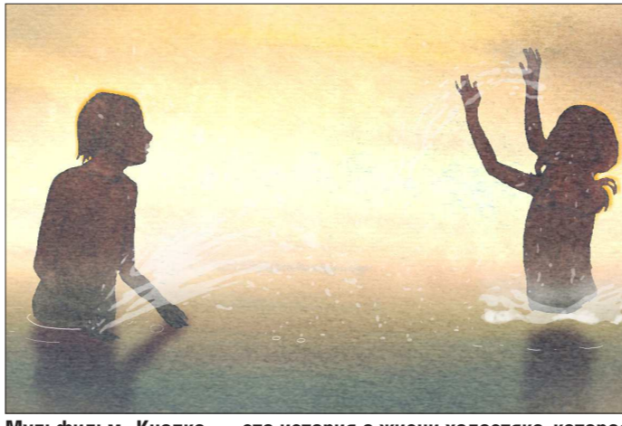
Мультфильм «Кнопка» — это история о жизни холостяка, которая освещена лишь монитором компьютера. Однажды он случайно обнаруживает записку из детства и отправляется на поиски утраченного счастья...

Конкурсная программа поделена на шесть номинаций: короткометражные фильмы, дебютные, студенческие работы, сериалы, прикладная анимация и, конечно же, полнометражные картины.