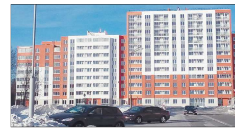
Все работы по строительству и отделке дома велись исключительно подрядчиками из Лесного, что позволило дать новые рабочие места и повысить опыт местных организаций в выполнении строительно-отделочных работ

Заказчиком проекта выступила фирма из Екатеринбурга. В строительстве применены технологии стичного домостроения – монолитная конструкция строения и отделка мокрой штукатуркой с утеплителем позволяют отлично сохранять тепло.