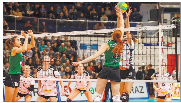
«Уралочка» сыграла в Дрездене молодёжным составом