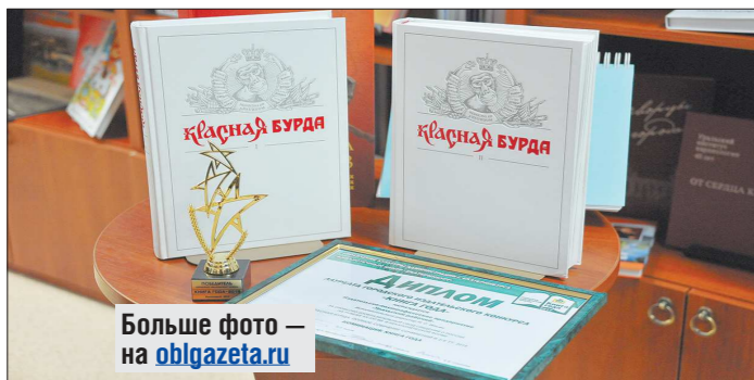
Больше фото — на oblgazeta.ru

Играть в КВН авторы этого двутомника перестали больше 25 лет назад, а вот привычку сочинять не утратили до сих пор. Теперь результаты их творчества можно прочитать не только в формате юмористического журнала, но и в книжном варианте, который очень высоко оценило жюри «Книги года—2016»