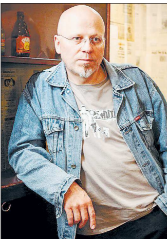
Яцек Матецкий стал своим на Урале

В Польше вышла в свет книга «Драма номер три», посвящённая одноимённому театру из Каменска-Уральского. Автор книги — известный польский писатель Яцек МАТЕЦКИ, приехавший на Урал несколько раз в 2016 году и проживший здесь в общей сложности около 2 месяцев. 288-страничный фолант написан в востребованном сейчас в Европе жанре записок путешественника.