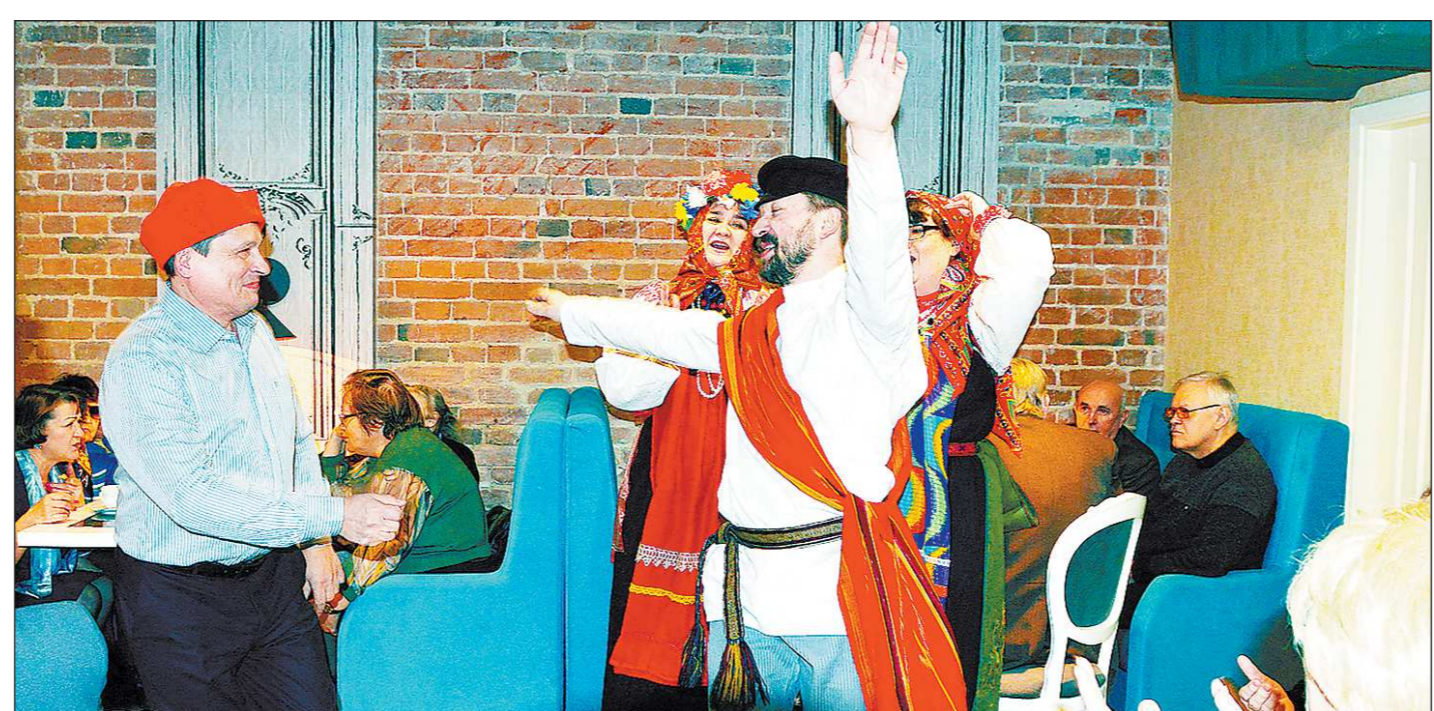
Ассоциация народов Урала угостила ветеранов журналистики блинами и порадовала задорным концертом

Свердловчан в возрасте 100 лет и старше — больше 170 человек.