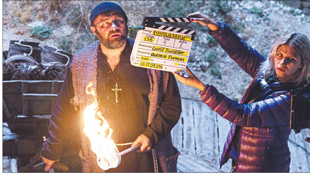
Карпатские горы, где разворачивается действие фильма, снимали в Крыму

На экраны вышла картина «Вурдалаки» — это ещё одна попытка снять отечественный фильм в жанре мистического триллера.