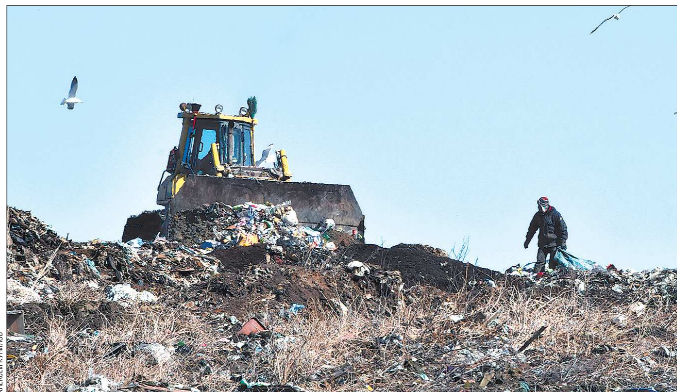
Площадь, которую сегодня занимают отходы в регионе, составляет 17 тысяч гектаров (это примерно два с половиной Первоуральска)