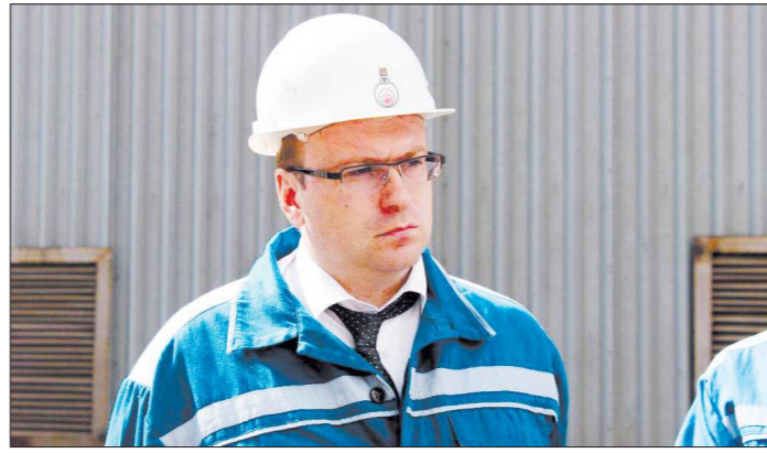
Министр природных ресурсов и экологии Алексей Кузнецов регулярно бывает на предприятиях области и контролирует ход модернизации вредных производств

— Положительная динамика очевидна. Каким же