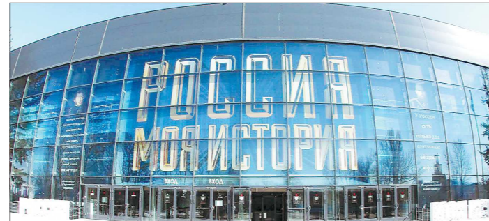
Открывшись, исторический парк в Москве побил рекорды посещаемости — до 19 000 посетителей в день

Профицит вырабатываемых мощностей обеспечит возможность дальнейшего выезда из эксплуатации неэффективного и выработавшего свой ресурс генерирующего оборудования.