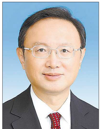
Член Госсовета КНР Ян Цзечи заявил, что «Один пояс и один путь» будет не только выступлением Китая, а симфонией всех стран-участниц

В форуме «Один пояс и один путь» примут участие лидеры многих стран и руководители международных организаций. Член Госсовета КНР Ян Цзечи ответит на вопросы китайских журналистов по поводу данного мероприятия, прояснит его главные цели и ожидаемое влияние на глобальную экономику и международное сотрудничество.