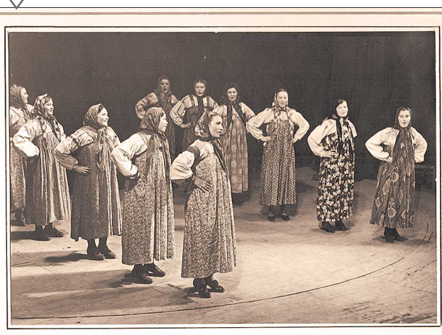
Народный танец «каличка» Иск. рабочие подзащитного труда, г. В.Ташма

Сегодня в рамках проекта «Вместе» о своём муниципалитете рассказывают журналисты одной из старейших свердловских газет — «Красное знамя». В архиве редакции сохранился снимок 1946 года, запечатлевший выступление работниц «подземного труда» на областном смотре художественной самодеятельности. Ранее маленький рабочий посёлок носил название Медный Рудник, именно в 1946 году он стал Верхней Пышмой, которую сегодня называют Медной столицей Урала