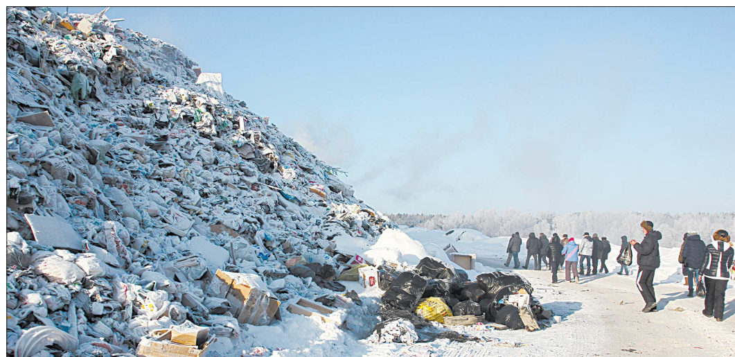
1 февраля по определению городского суда наконец-то прекращён приём мусора на полигон

Свалка близ посёлка Красного площадью более 5 га выросла за годы эксплуатации так, что уже возвышается над лесом, а дым от бесконечного горения её содержимого душит жителей не только Красного, но и ближайших посёлков. С ноября 2012 года приём твёрдых бытовых отходов на свалке ведёт торговая-промышленная компания «Благо-С». С 2014 года в редакцию нашей газеты «Красное знамя», в администрацию городского округа Верхняя Пышма, в Роспотребнадзор и другие инстанции на свалку регулярно жалуются жители.