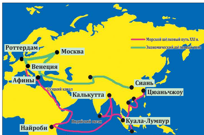
Объединённый проект «Один пояс и один путь» охватывает большую часть Евразии, соединяя новые экономики и развитые страны

Он отметил, что форум станет логическим продолжением неофициального саммита глав государств АТЭС в Пекине в 2014 году и Ханчжоуского саммита G20 в 2016 году.