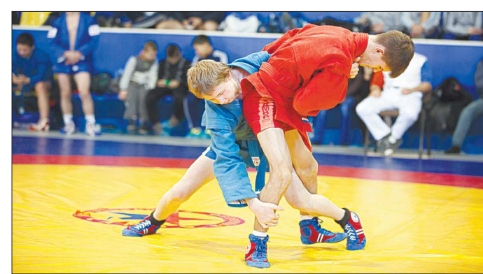
Если бы существовал такой показатель, как количество самбистов на тысячу жителей, то Верхняя Пышма не имела бы равных среди всех муниципалитетов