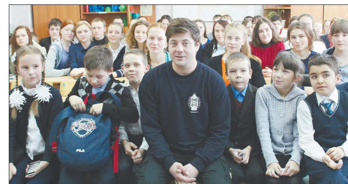
После беседы школьники устроили фотосессию с актёром