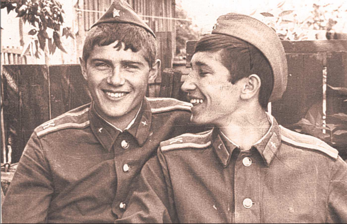
1975 г. С курсантских времён его жизненное credo укладывается в одно слово – служение.

– Как вы суеверный человек? Если – да, каким приметам верите? – Грешно, конечно, но верю и снам, и гаданиям... А потом каюся – всё ведь в руках Божьих! – Из каких периодов предпочитаете узнавать о мире? – Бывает, что подполг смотреть сериалы: исторические (про викингов, Хоррею и Кёсем) или военные. Конечно – информационные программы. Привычка от бывшей профессии политработника. Шоу-программы не люблю (ор, хамство, рваный ритм), предпочитаю – спокойную аналитику, беседу с умным человеком, передачу-портреты.