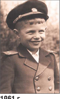
1961 г. Спуста годы он напишет «Балладу о сыновьях», которая станет песней, и сегодня её поют десятки хоров от Чыты до Гатчины

– Как вы суеверный человек? Если – да, каким приметам верите? – Грешно, конечно, но верю и снам, и гаданиям... А потом каюся – всё ведь в руках Божьих! – Из каких периодов предпочитаете узнавать о мире? – Бывает, что подполг смотреть сериалы: исторические (про викингов, Хоррею и Кёсем) или военные. Конечно – информационные программы. Привычка от бывшей профессии политработника. Шоу-программы не люблю (ор, хамство, рваный ритм), предпочитаю – спокойную аналитику, беседу с умным человеком, передачу-портреты.