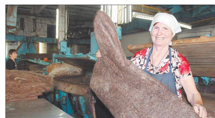
На фабрике работают около 100 человек