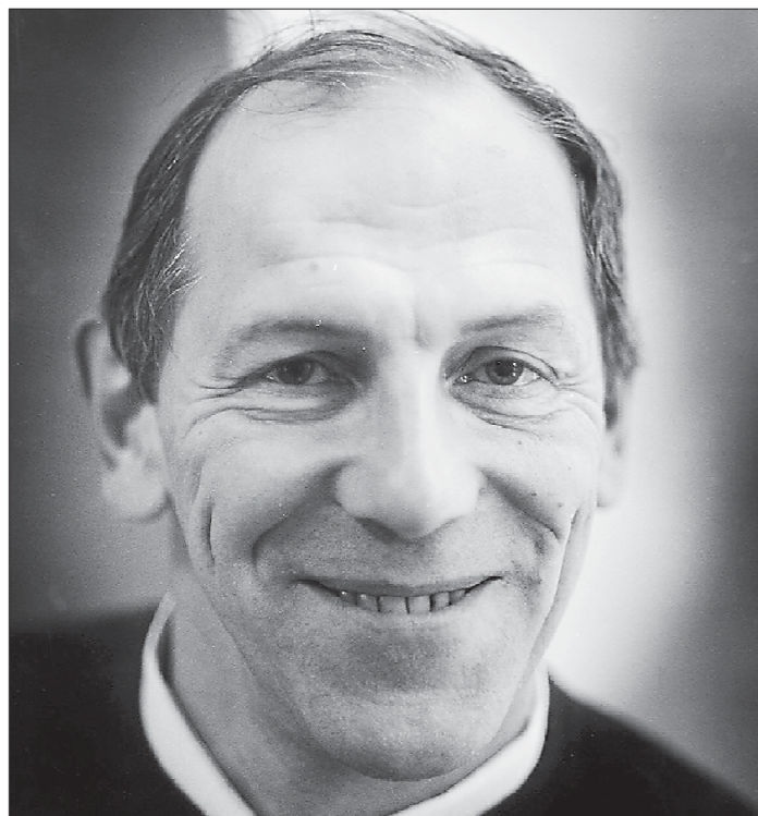
Валерию Рубакову не раз поступали предложения поработать за рубежом, но он их отверг

Рубакова называют вундеркиндом, с ранних лет проявившим блестящие способности и доказавшим право на занятия большой наукой. Мировую известность он обрёл в 26 лет — благодаря эффекту, названному его именем. Речь идёт о так называемом монополярном катализе распада протона. Дело в том, что теоретически предсказано существование магнитных монополей — элементарных частиц с магнитным зарядом. «Я же показал, что если взять довольно широкий класс моделей элементарных частиц, то при взаимодействии с такими монополями протоны должны превращаться в другие частицы с большим энерговыделением,