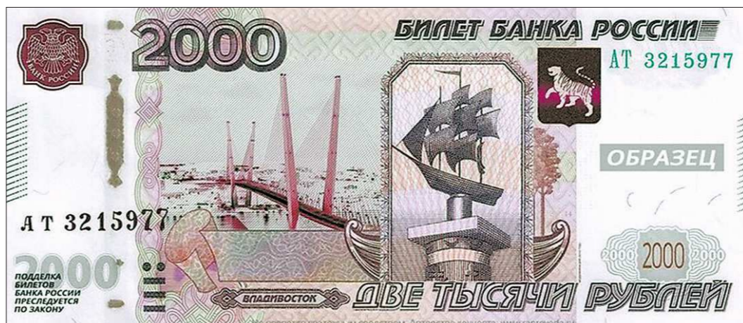
Так выглядит один из эскизов купюры «Владивосток-2000»