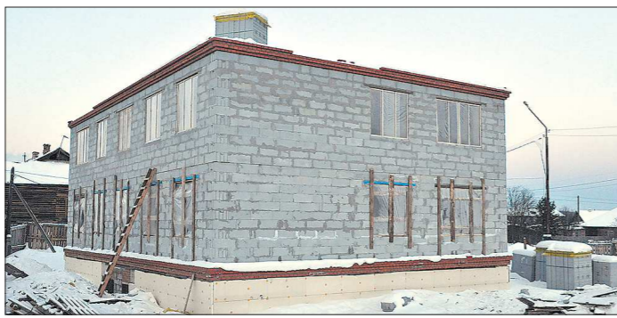
Подрядчики уверяют, что холода строительству — не помеха. Заснеженные блоки за домом пообещали не использовать и вывезти с участка