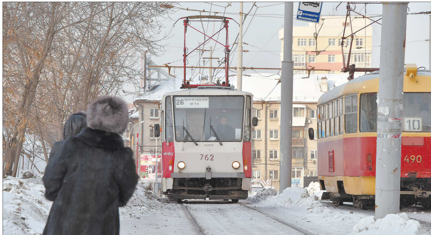
Трамваи и троллейбусы в Екатеринбурге в год перевозят 115 миллионов пассажиров

Руководители ТТУ объяснили, как внедрение новой маршрутной сети отразится на движении трамваев и троллейбусов в Екатеринбурге