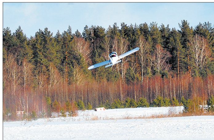
На взлёт и посадку легкомоторным самолётам достаточно ста метров

Володя тем временем пыхтит и с товарищем пятаётся из обычных верёвок установить своеобразные растяжки на лыжи, чтобы плотнее их зафиксировать. Чувствуется, что ему невтерпёж обкатать новую ма-