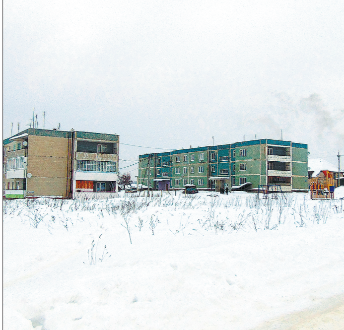
Из 660 жителей Конёво в многоквартирных домах зарегистрированы 153 человека, а по факту живут 123, остальные оставили квартиры безхозными

Каково это — ходить по дому в валенках — знает каждый из 153 жителей села Конёво, прописанных в многоквартирных домах. До 2016 года старенькая угольная котельная (на местном диалекте «котельня») не справлялась с отоплением четырёх жилых домов, школы, садики, клуба и пожарного депо. Что-нибудь да приключалось с ней — то котлы выйдут из строя, то некачественный уголь подвезут, то коче-