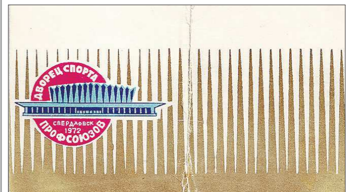
Приглашение на открытие Дворца спорта профсоюзов