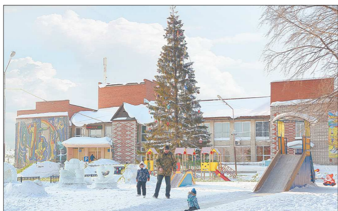
Ледовый городок на центральной площади Шали - любимое место местной детворы. Да и взрослых сюда силой тянуть не надо. Идут с охотой. А фото и селфи на ледовом троне и у петуха набрали у шалинцев больше всего лайков в социальных сетях

ОБЛАСТНАЯ ГАЗЕТА www.oblgazeta.ru Пятница, 20 января 2017 г.