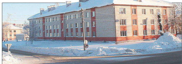
За последние три года улица Энгельса в Шале изменилась до неузнаваемости. Так, вместо целого квартала деревянных бараков теперь три многоквартирных дома. Правда, помимо радости новосёлам, новостройки ещё и добавили забот коммунальщикам: им придётся модернизировать систему отопления

В Шале строят много. С 2012 года в эксплуатацию сдали 7 169 квадратных метров жилплощади. Чтобы стал понятен масштаб, скажем, что в 2015 году 51 процент шалинцев, стоящих на учёте по улучшению жилищных условий, получили новые квартиры (по области этот показатель - 9,8 процента). В прошлом го-