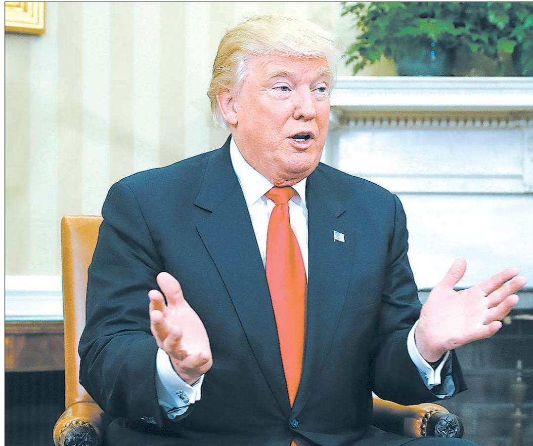
Трамп впервые посетил Белый дом в качестве избранного президента в начале ноября прошлого года

Знавала империя Трампа и небедные времена. Когда в конце 1990-х в США разразился кризис недвижимости, Дональду даже пришлось заложить «Трамп Тауэр», чтобы рассчитаться с кредиторами.