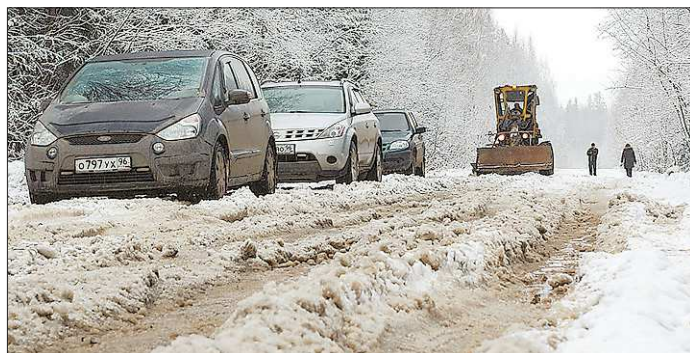
В 2016 году областное правительство выделило на ремонт дороги 11 миллионов рублей

О состоянии дороги до Серебрянки на пресс-конференции Владимиру Путину рассказал журналист Максим Румянцев. Президент пообещал обратить внимание губернатора на проблему и отметил, что «все жители России, независимо от места проживания,