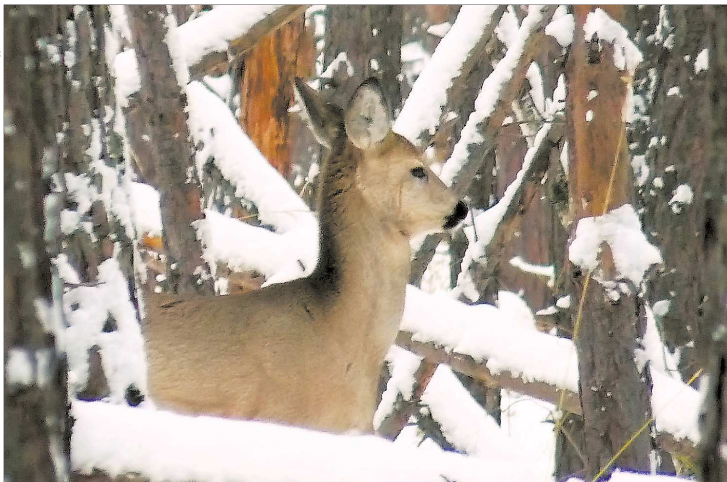
Во многом благодаря Богдановичскому охотничьему заказнику популяция сибирской косулы у нас в области растёт из года в год, и покупатели за ней едут из Карелии, Смоленщины и даже из Хабаровска

В Свердловской области 1 641 особо охраняемая природная территория