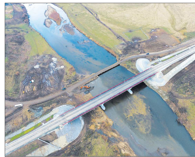
Первые сваи нового моста в селе Невьянское были вбиты 4 июня 2014 года

контроль, акты о приёмке выполненных работ не подписывались и оплата не производилась. В конце октября прошлого года подрядчик в одностороннем порядке, без объяснения причин прекратил все работы, вывез дорожную технику. На предъявленные претензии подрядчик ответов не представил. Контракт на данный момент не расторгнут.