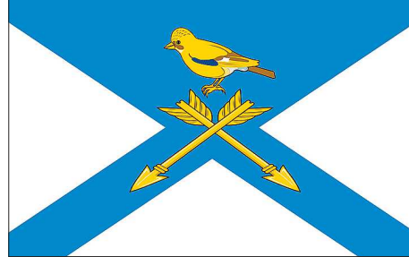
На флаге Тугулымского района, принятом в 2004 году, изображены сойка и две стрелы на фоне косоугольного креста