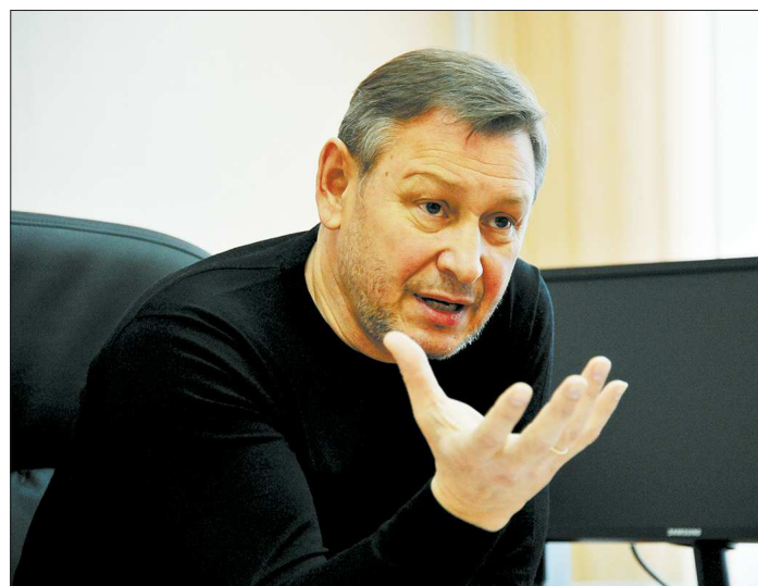
По словам Александра Косинцева, суть проектных офисов чем-то напоминает Госплан, который существовал в СССР

— Например, один из проектных офисов будет заниматься вопросами развития промышленности, агропромышленного комплекса, транспорта и связи. Ключевым направлением этого офиса станет крупнейший проект — Титановая долина. Смотрите, здесь задействованы интересы МУГИСО, минпрома, минэнерго, минтранса и, возможно, ещё каких-то иных министерств, в зависимости от того, какие проекты будут реализовываться на территории долины. Так вот, когда одно министерство пытается решить свои локальные задачи, ему приходится обязательно согласовывать свои позиции с остальными ведомствами. Чаще всего эта рутинная работа затягивается и превраща-