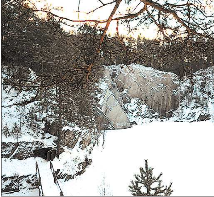
Памятник природы Тальков Камень под Сысертью прекрасен и зимой, и летом