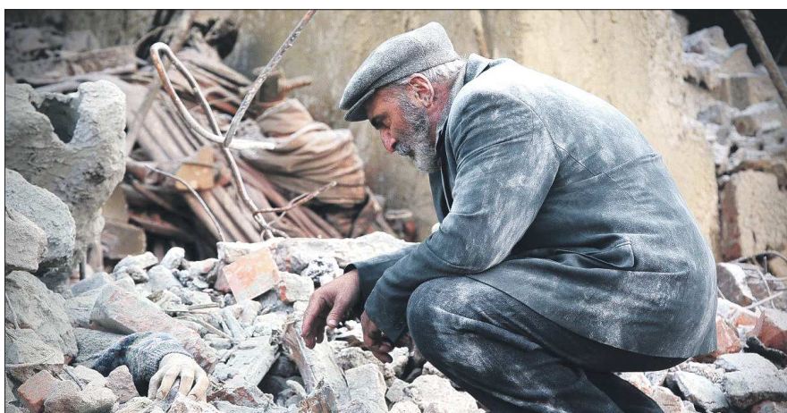
Каждый съёмочный день завершался минутой молчания — в память о жертвах землетрясения

Год российского кино подходит к своему логическому финалу. И уже стало понятно, что положительные сдвиги есть. Так, в этом году российские режиссёры сделали сразу несколько фильмов-катастроф, которые не только заслуживают внимания, но и наконец-то смогли переиграть интерес зрителя с западного продукта. Ещё совсем недавно в прокате прогремел «Леда», перед ним с большим успехом прошёл «Экипаж», а затем эстафету подхватило «Землетрясение». Российские режиссёры взялись за масштабные, дорогостоящие проекты, которые в целом получились весьма успешными. А зрители, в свою очередь, дали нашему кино шанс и, наверное, поняли, что фильмы-катастрофы бывают не только о пришельцах и гигантских цунами.