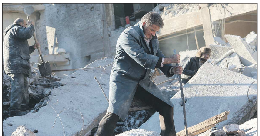
Съёмки фильма длились 42 дня и проходили в Москве и городе Гюмри (бывший Ленинакан)

В прокат вышел фильм «Землетрясение», рассказывающий о трагедии, случившейся в Армении в 1988 году. Тогда в результате сильнейших толчков были разрушены города Спитак, Ленинакан, Кировакан, Степанаван и ещё более 300 населённых пунктов. По официальным данным, погибло около 25 тысяч человек, 19 тысяч стали инвалидами и около полутора миллиона остались без крова. И вот на экран выходит первая киноистория о событиях 28-летней давности.