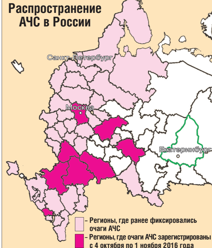
Распространение АЧС в России

Всё чаще появляется информация о том, что генетический материал вируса африканской чумы свиней (АЧС) обнаруживают в колбасах и других мясных изделиях, изъятых проверяющими уже в торговой сети.