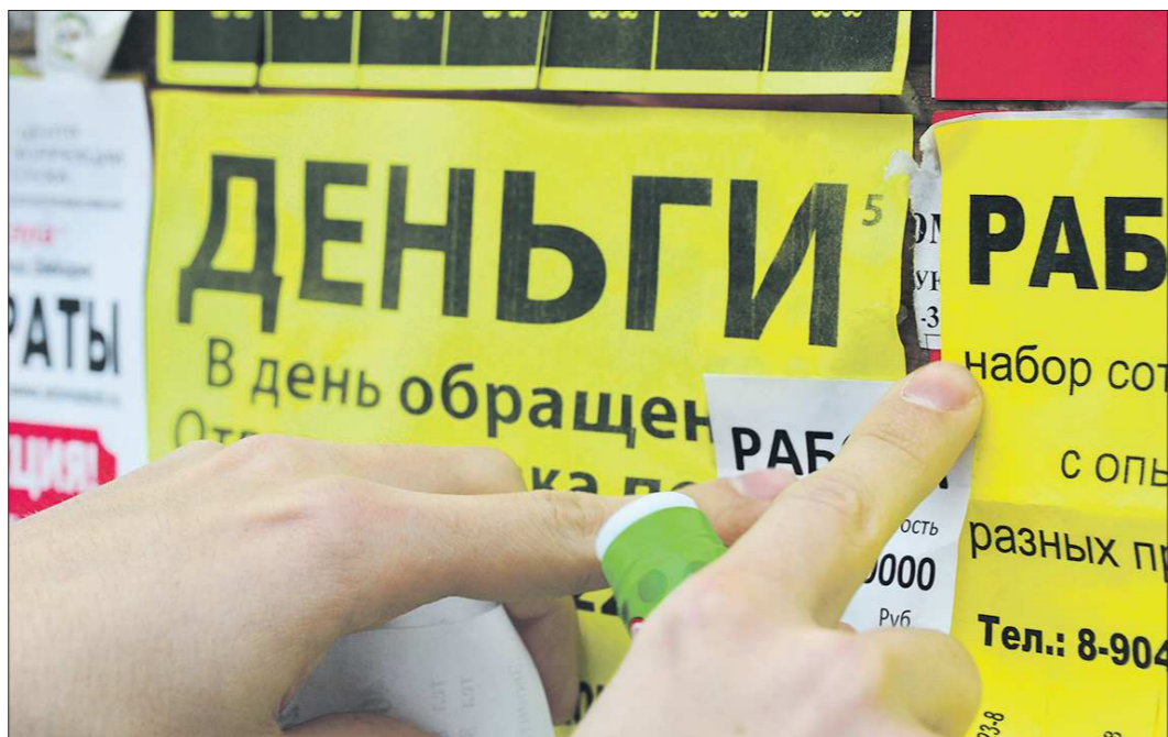
Микрофинансовые организации предлагают моментально оформить кредит под высокие проценты. Взяв его, потребитель фактически попадает в рабство — сумма, которую требуется вернуть, с каждым днем растёт в геометрической прогрессии