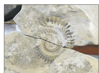
Самый ценный экземпляр коллекции — отпечаток зубного аппарата геликоприона

— Младшему внуку сейчас шесть лет, старшему — девять. В походы они со мной ходят уже три года, с самого раннего возраста. Уже различают виды растений в окаменелостях, сами не раз находили трилобитов, знают, как выглядят кости динозавра. У них есть свои рюкзаки, профессиональная экипировка. Ходить на раскопки им очень нравится, глаза горят, — рассказала «ОГ» палеонтолог-любитель.