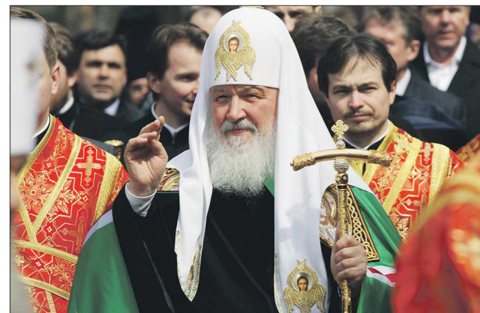
2013 год. Патриарх Кирилл во время своего второго визита в Свердловскую область в монастыре на Ганиной Яме