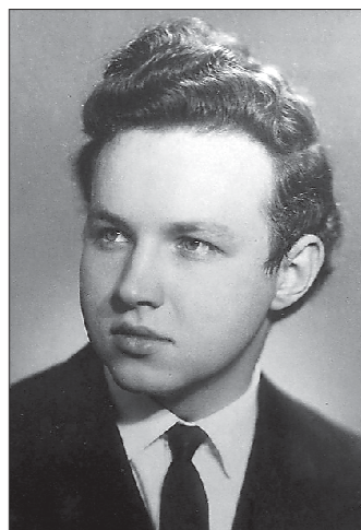
1960-е годы. Будущий Патриарх Кирилл. Больше фото — на oblgazeta.ru

арх Кирилл бывал дважды: в 2010 и 2013 годах.