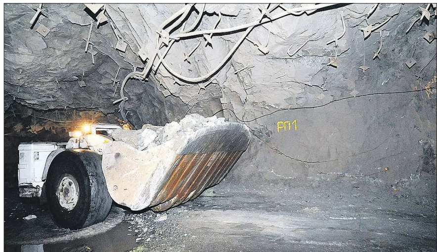
Такие погрузочно-доставочные машины, работающие на добычных и проходческих работах, понадобятся и для оснащения нового горизонта шахты

Казалось бы, шахте уготована та же участь, что и мно-