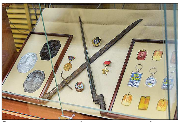
Два штюка: слева — японский, справа — от легендарной Московской винтовки. В память о сражении на Халхин-Голе