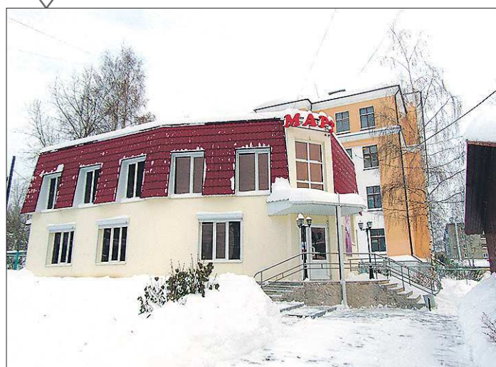
В Кушве «Март» стал монополистом