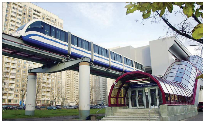
В Москве монорельсовая дорога перевозит пассажиров с 2004 года

— Затраты на строительство 10 километров такой дороги в шесть раз ниже, чем на строительство тех же километров линии метро. Как сообщили нам в проектно-изыскательском институте транспортного строительства «Уралгипротранс», цена проекта изысканий для строительства монорельса — порядка одного миллиона рублей за километр. Исходя из этих рас-