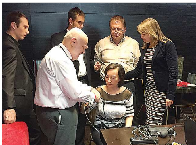
Профессия полиграфолог довольно редкая, на весь Екатеринбург — 30-40 таких специалистов

В минувшие выходные в Екатеринбурге собрались лучшие полиграфологи со всей России, а также специалисты из Белоруссии, Казахстана, Израиля, США, Мексики и Коста-Рики. В столице Урала прошла четвертая международная научно-практическая конференция «Реальная практика полиграфологов». Корреспондент «ОГ» общалась с теми, кто умеет отличать ложь от правды не хуже доктора Лайтмана из сериала «Теория лжи».