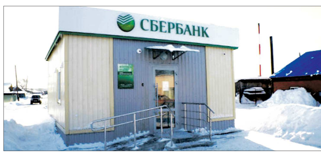
В Кузино (Первоуральский ГО) зимой появился модульный Сбербанк

Напомним, что практика временного размещения свободных средств федерального бюджета на банковских депозитах начала формироваться в 2008 году.