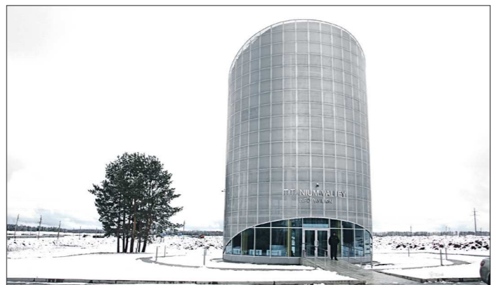
Снимок слева был сделан весной 2014 года, тот, что справа — два дня назад. Единственным видимым отличием мог стать построенный корпус «ВСМПО-Новые технологии», но он не попал на фото

Традиционно перед принятием областного бюджета депутаты свердловского Заксобрания побывали на площадке особой экономической зоны «Титановая долина».