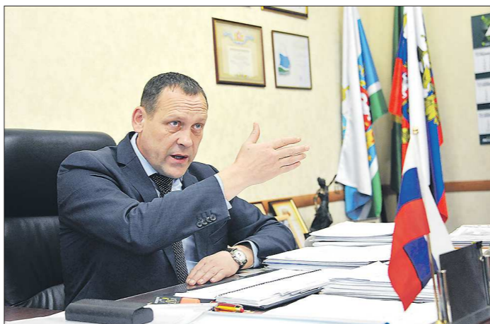
В здании, где находится администрация, в начале XX века заседал 1-й Совет, а в годы Гражданской войны была тюрьма. Мечта мэра — сделать здесь музей рабочего движения, а администрацию перенести. Правда, здание нуждается в ремонте — пару лет назад одна из балок перекрытия прогнила, и чуть не затопило местный избирком

— Алапаевск и Алапаевский район считаются разными муниципалитетами. Как вы взаимодействуете? — Всё переплетено: самостроительство города зависит от района, самоуправления района — от города.