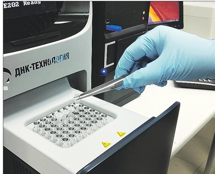
Один из этапов обнаружения ГМО в продукции заключается в достраивании цепочки ДНК

— Уже доказано, что люди, питающиеся продукцией, содержащей ГМО-объекты, быстрее полнеют, есть факты наличия гормональных изменений, влияния на ход процесса беременности, иммунитета, нарушение дисбиоза слизистых, особенно кишечного тракта, чувствительности организма к антибиотикам и так далее. Многочисленные опыты на животных подтверждают, что ГМО может неблагоприятно отразиться на будущем потомстве. Поэтому точно сказать, как ГМО скажется на человеке, мы сможем лишь через поколение, а это 50 лет. На данный момент статистическая база данных не позволяет нам с полной уверенностью