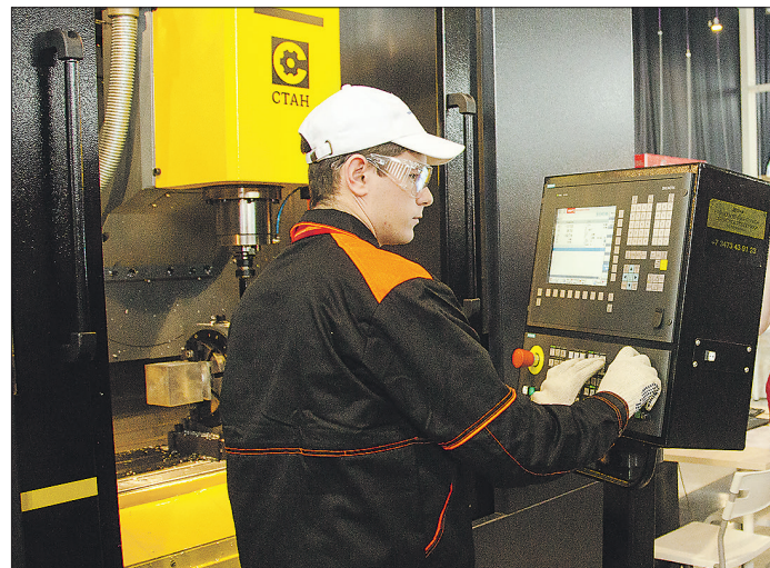
Станок с ЧПУ заменяет десяток специалистов высочайшей квалификации, работающих по старинке

Вчера III Национальный чемпионат WorldSkills Hi-Tech, который проходит в МВЦ «Екатеринбург ЭКС-ПО», открылся пленарным заседанием «Кадровая индустриализация: даём промышленный рост».