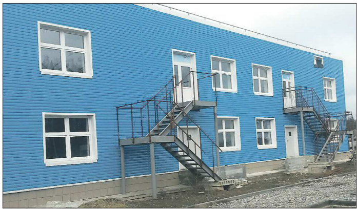
Юшалинский садик должны были ввести в эксплуатацию в декабре. Но из-за того, что придётся проводить новый конкурс и заключать контракт с новым подрядчиком, процесс затянется

Почти год назад «ОГ» писала о рекордных темпах строительства детских садов в области возле и реконструировали 73 садика для 14 тысяч детей. Но оказалось, что в реализации майского указа муниципалитеты наступили на те же грабли, что и при строительстве программных домов.