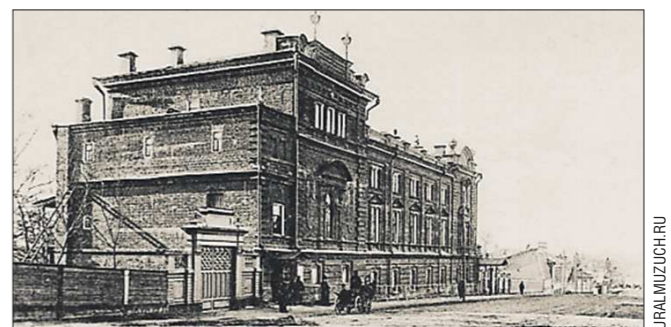
Концертный зал Маклецкого торжественно открылся 14 ноября 1900 года. В разное время в нём выступали Шостакович, Прокофьев, Ойстрах и Нейгауз