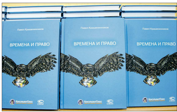
Книга вышла тиражом три тысячи экземпляров и, по словам самого автора, будет интересна юристам и студентам юридических вузов, а также любителям истории. Павел Крашенинников затруднился сказать, какой по счёту из написанных стала «Времена и право»: «Из исторических, наверно, 25-й»

30 октября — скорбная дата в российском календаре — День памяти жертв политических репрессий. Он напоминает нам о целой эпохе тоталитарного режима, когда миллионы наших соотечественников были осуждены только за то, что осмелились высказывать собственное, несогласное с официальным, мнение, политические и религиозные убеждения; подвергались гонениям, арестам по причине национальной или социальной принадлежности.