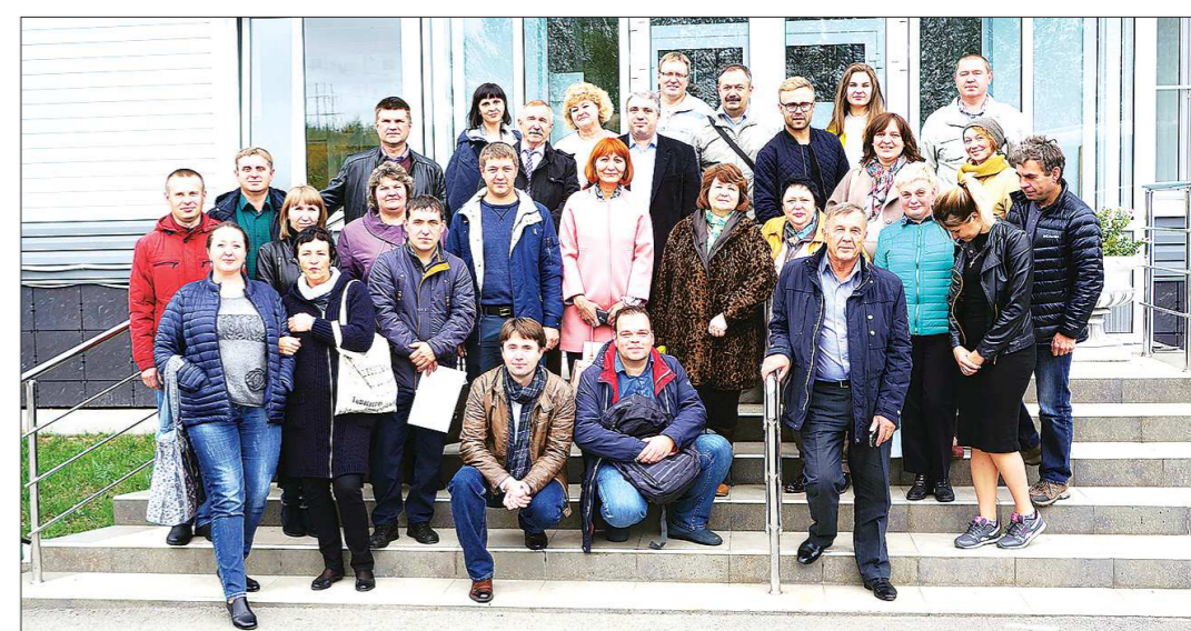
Экскурсия по предприятию произвела на участников семинара неизгладимое впечатление

На семинаре участники познакомились с предложениями по улучшению производства творога, творожных продуктов и сыров, рассмотрели варианты модернизации производственных участков. Обсудили новые