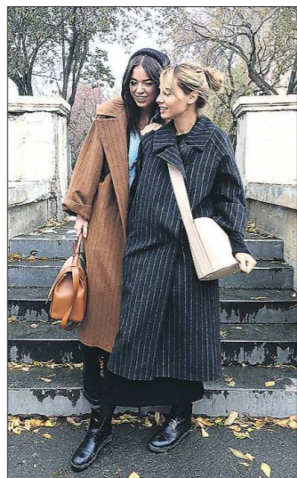
Пальто из новой коллекции бренда UShatava — типа «оверсайз», с широким воротом, в полосу. В этом сезоне они стали хитом

В женской верхней одежде в этом сезоне можно выделить несколько тенденций, которые прослеживаются в мировой моде.