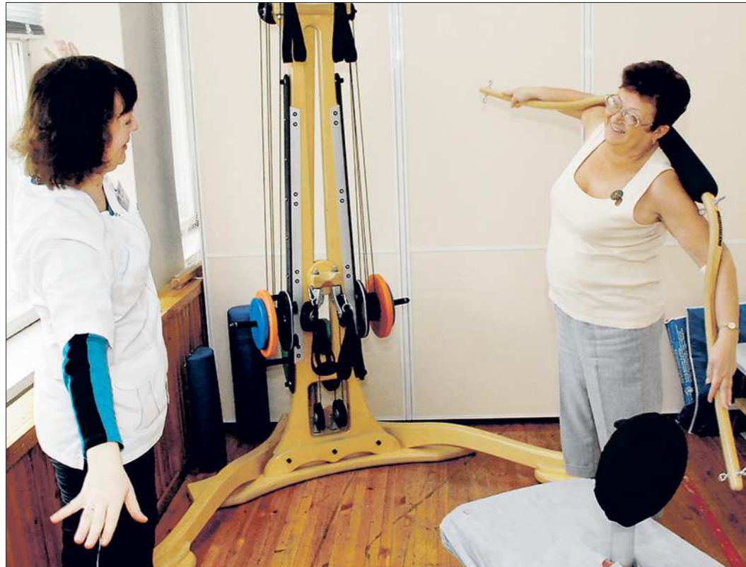
Лечебная физкультура — самый распространённый метод оздоровления в санаториях, он не имеет никаких противопоказаний

Такие направления на госпитализацию дают больным