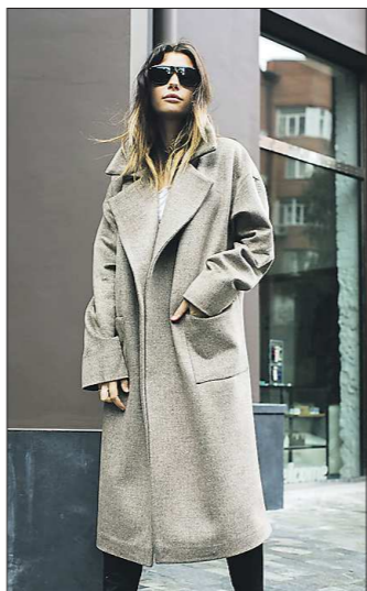
Ещё один образец популярного пальто — от бренда «SiammSiamm». Серые и пудровые оттенки есть в каждой коллекции