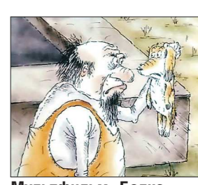
Мультфильм «Белка... и Стрелка» включён в фестивальную программу для взрослых, где собраны фильмы о российской жизни постперестроечных лет и не только

МОСКВА. Сегодня в столице открывается X Большой фестиваль мультфильмов. В течение 12 дней на 20 киноплощадках города будет представлено 50 уникальных программ российских и мировых анимационных фильмов.