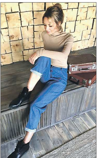
Бренд UShatava предлагает водолазки в разных расцветках, но самым популярным стал карамельный