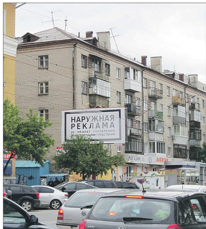
Дело УФАС о рекламных щитах стало прецедентным. Ведомство намерено контролировать процесс вывода рекламного рынка из тени

Договоры с ними до сих пор не заключены, так как ещё до проведения аукциона Челябинская компания «Продвижение» направила жалобу в УФАС, заявив, что документация в конкурсе была разработана «под заранее известное и определённое лицо». Как сообщили «ОГ» в УФАС, по итогам проверки комиссия усмотрела нарушения в действиях организаторов Фонда имущества Свердловской области. 21 октября было вынесено требование