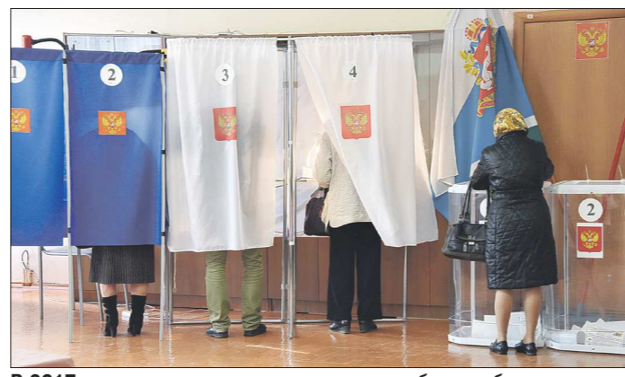
В 2017 году свердловчанам предстоят выборы губернатора и 56 местных дум

Никаких проблем по формированию органов местного самоуправления в муниципалитетах нет. Не схемы управляют людьми. Поэтому придавать какое-то судьбоносное значение той или иной схеме по формированию органов МСУ я бы не стал. В конце концов всё упирается в квалификацию тех людей, которые претендуют на должность. Если отойти от формальной сторо-