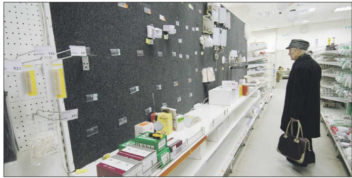
«Трест СКМ» работает на рынке с 1993 года. В составе компании 29 магазинов формата «СуперСтрой» и 3 гипермаркета «СтройАрсенал»