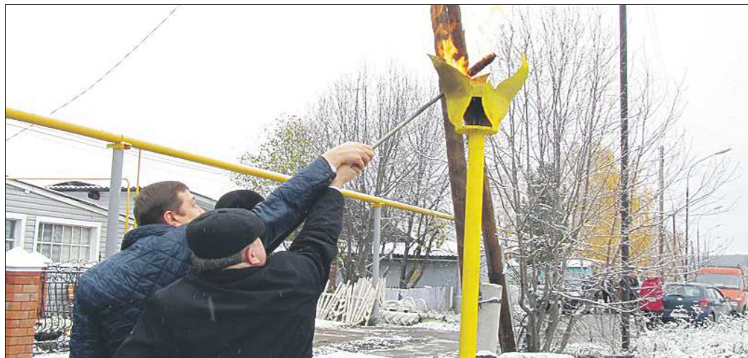
После торжественного пуска газопровода бродовцы разошлись проверять работоспособность печей, которыми не пользовались с советских времён