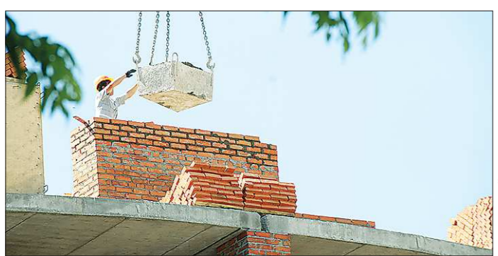
Застройщики отмечают, что строить в объемах прошлых лет сейчас нерентабельно — покупателей немного

Самый старший в области бизнес-инкубатор находится в Верхней Салде — в 2003 году под него приспособили бывшее здание милиции. Первые его резиденты могли рассчитывать только на льготную аренду.