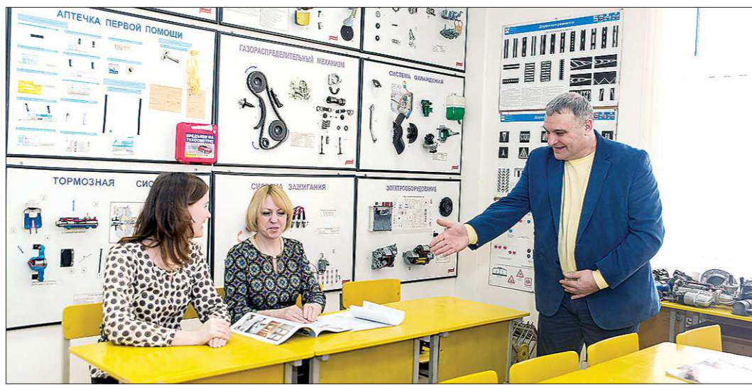
В Невьянске на площадях бизнес-инкубатора открыли автошколу

В региональном министерстве инвестиций и развития закончили принимать заявки на конкурс по размещению предпринимателей в Свердловском областном бизнес-инкубаторе.