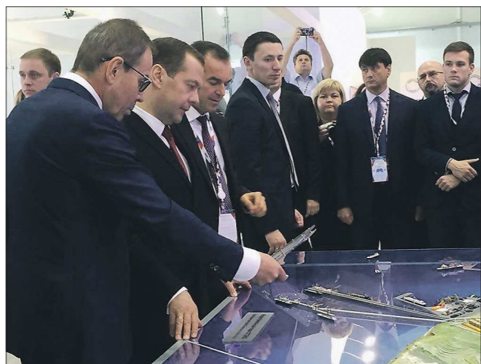
Председатель правительства России Дмитрий Медведев осматривает экспозицию Краснодарского края

МИНИСТЕРСТВО ПРИРОДНЫХ РЕСУРСОВ И ЭКОЛОГИИ РФ, ФЕДЕРАЛЬНАЯ СЛУЖБА ПО НАДЗОРУ В СФЕРЕ ПРИРОДОПОЛЬЗОВАНИЯ И ОО «УРАЛСБЕСТ» ПОДПИСАЛИ СОГЛАШЕНИЕ О СОТРУДНИЧЕСТВЕ. Согласно документу, предприятие в ближайшие два года должно снизить выбросы вредных веществ и исключить сброс неочищенных дренажных вод в реку Большой Рефт, а для этого — инвестировать в собственную экологическую программу около 75 миллионов рублей. По словам Евгения Куйвашева, участие промышленных предприятий в работе по экологическому оздоровлению региона — это яркий показатель их социальной ответственности.