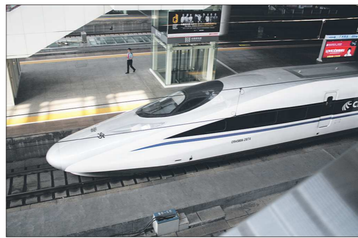
У поездов специальная воздухообтекаемая форма кабины, которая позволяет развивать высокие скорости

Из одного города Китая в другой можно комфортно и быстро передвигаться на поездах. Например, чуть больше сотни километров от Гуанчжоу до Шэньчжэня высокоскоростной поезд проезжает за 44 минуты, по пути делая несколько коротких остановок. Состав может разогнаться до 300 километров в час. Стоит это недорого — 74,5 китайского юаня или примерно 750 рублей, но свободных мест в вагонах нет.