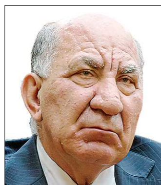
Владимир РАДАЕВ Список партии «Единая Россия»