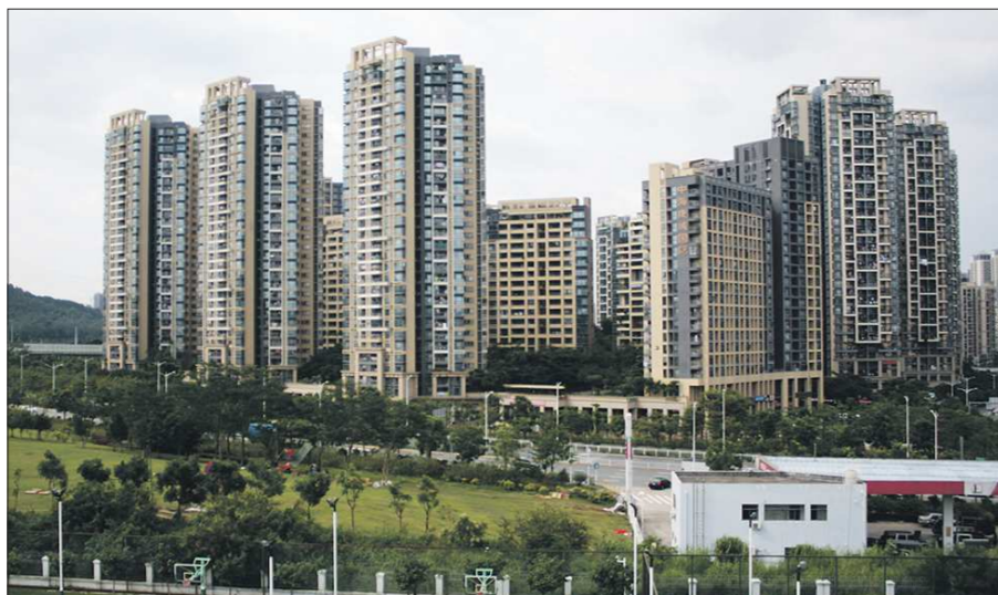
Отличительная черта современного Китая — высотное строительство. Даже жилые кварталы состоят из небоскребов

В 1979 году на юге Китая в провинции Гуандун на месте небольшого рыбацкого городка с населением 30 тысяч человек началось строительство мегаполиса Шэньчжэнь. Главным на тот момент реформатор КНР Дэн Сяопин решил разместить здесь особую экономическую зону. Уже через 20 лет в Шэньчжэне жили более семи миллионов человек. Сейчас, всего 37 лет спустя после основания, это город с населением около 19 миллионов человек, густо усеянный футуристического вида зданиями, один из трёх ведущих финансовых центров страны. Здесь располагается третий в мире по объёмам грузооборота