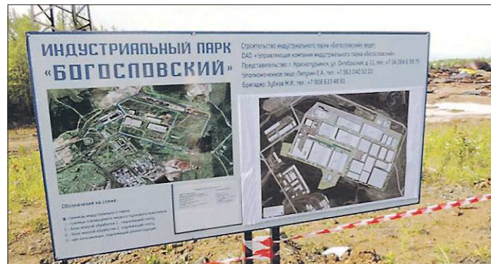
Площадь индустриального парка «Богословский» — 86 гектаров. 20 процентов полезной площади промпарка займут шесть предприятий-резидентов, с которыми уже заключены договоры аренды земельных участков