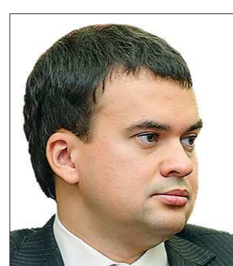
Игорь АКСЁНОВ Список КПРФ