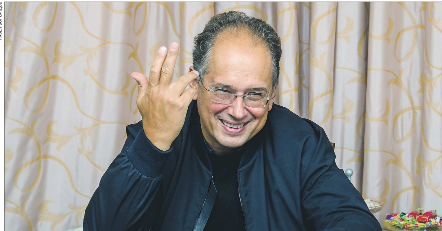
Дмитрий Лисс — лауреат Государственной премии России в области литературы и искусства, народный артист Российской Федерации. Он возглавляет Уральский государственный академический филармонический оркестр уже 21 год

Уральский государственный академический филармонический оркестр отметил 80-летие