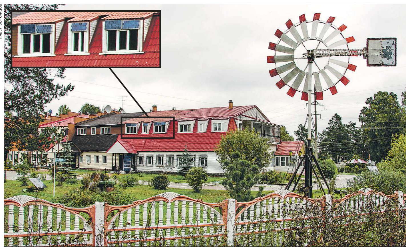
Солнечные панели (выделены на фото), расположенные на окнах двух квартир, на крыше дома и на специальных установках, выдают постоянный ток и заряжают аккумуляторы. Накопленную электроэнергию можно пустить на освещение светодиодными лампами при 12 вольтах либо преобразовать в переменный ток, чтобы можно было включать электроприборы

Первый в России дом, где используется энергия солнца, ветра и воды, построили уральские учёные