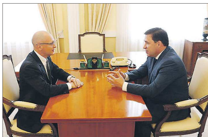
Сергей Кириенко сказал Евгению Куйвашеву, что Свердловскую область он приводит в пример другим

Вчера губернатор Свердловской области Евгений Куйвашев и глава госкорпорации «Росатом» Сергей Кириенко обсудили развитие муниципалитетов региона, где работают предприятия атомной промышленности. В рамках поездки на Урал Кириенко планирует посетить несколько таких территорий. В частности — Новоуральск, который уже готов войти в государственную программу по созданию территории опережающего развития (ТОР).