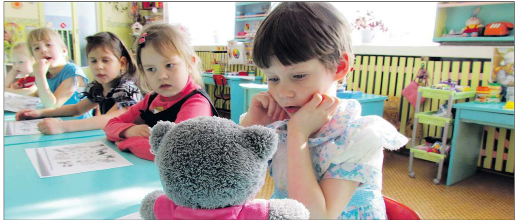
Нижеиринским родителям не нужно возить на занятия своих малышей: педагоги школы приезжают в детский сад сами