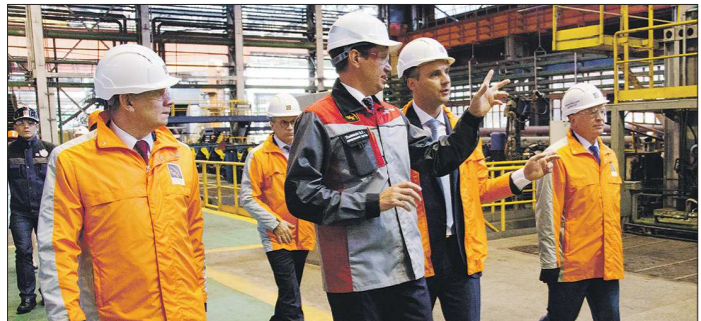
Во время экскурсии по заводу Денису Паслеру (на фото второй справа) рассказали, что за последние 10 лет на СТЗ в новые технологии вложили 1 миллиард долларов