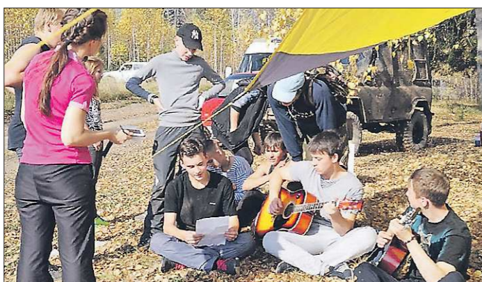
По субботам черноисточинские школьники не сидят за партами, а ходят в походы