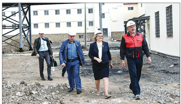
На территории СИЗО-7 ещё не сделали асфальтовое покрытие, поэтому проверяющих заранее попросили надеть удобную обувь