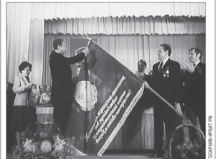
Борис Ельцин лично прикрепил орден Трудового Красного Знамени на знамя Ирбита. Сейчас награда хранится под охраной в администрации города