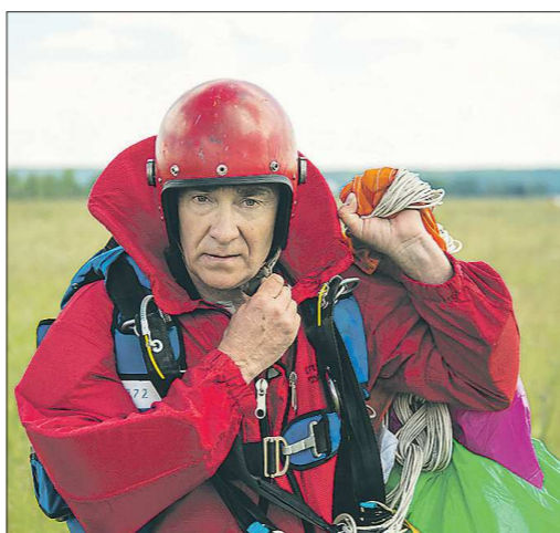
В костюме «Лесник» можно приземлиться хоть на деревья, хоть на воду