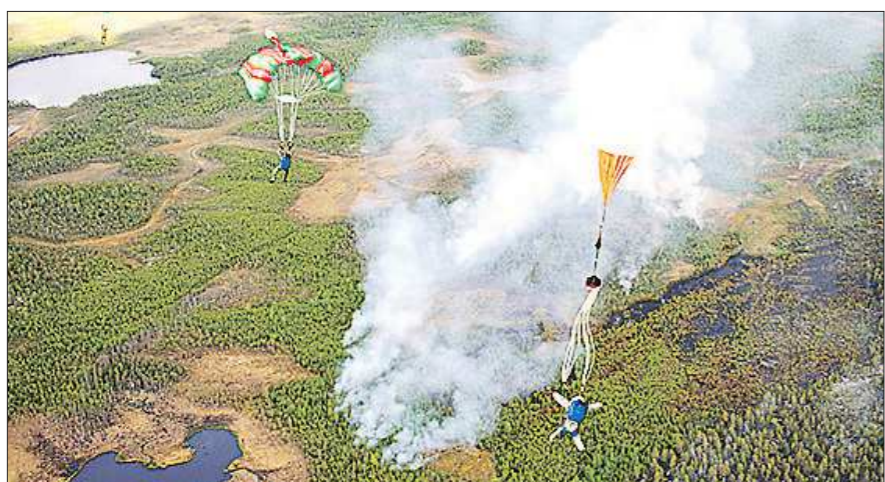
Параюты системы «Арбалет» позволяют приземлиться с точностью до одного-двух метров