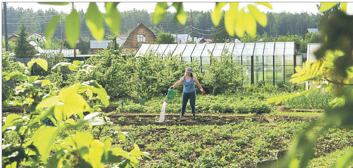
Как правило, участки в коллективных садах ещё с советских времён невелики — шесть соток. Кто ещё прикупил земли у соседей, по новому закону и взносы будет платить пропорционально больше