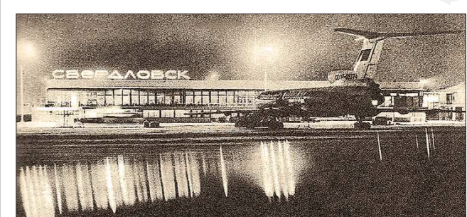
Главный уральский аэропорт носил название «Свердловск» до 1993 года