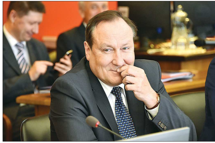
От нового министра ждут многого — люди хотят, чтобы медицина в отдалённых территориях оставалась доступной

УРАЛЬСКИЙ. Прошлым летом в ЗАТО Уральский закрыли круглосуточный стационар, уведомление о сокращении получили 9 медиков («ОГ» от 15.07.2015). Это возмутило жителей, и без того недовольных реформированием учреждения в филиал Белоарской ЦРБ в 2013 году. Проблема снова в транспортной доступности: автобус в Белоарку ходит всего раз-другой в неделю — до Екатеринбург до ехать значительно проще. Шум достиг федерального уровня, на молбы жителей Уральского откликнулся депутат Госдумы Лариса Фечина. Приехав в территорию, она рекомендовала региональному министерству здравоохранения позволить жителям Уральского получить медицинскую помощь в Екатеринбургской городской больнице №24. После этого такое решение всё же было принято, но система до сих пор не отлажена.