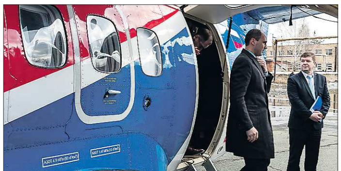
На территории аэропорта Уктус стоит настоящий 19-местный самолёт L-410. В апреле, в день открытия нового цеха УЗГА, его осмотрел председатель правительства региона Денис Паслер

Выбор Свердловской области в качестве пилотной площадки для реализации проекта неслучаен. Именно Средний Урал — крупный промышленный центр России — является одним из самых активных регионов по подготовке рабочих и инженерных кадров для промышленности, которая активно развивается. По данным Свердловскстата, объём промышленного производства в нашей области за январь-май 2016 года в сравнении с таким же периодом прошлого года вырос на 7,8 процента, в том числе добыча полезных ископаемых — на 7 процентов, обрабатывающие производства — на 8,4 процента, производство и распределение электроэнергии — на 5,9 процента.