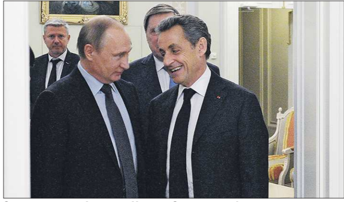
Экс-президент Франции Никола Саркози на форуме заявил, что лидерство Владимира Путина может помочь в деле сирийского урегулирования. «Я думаю, что нужно снять санкции, у нас достаточно проблем. Самый сильный должен протянуть руку первым. Самый сильный — это Путин», — сказал Саркози

Например, это закон о территориях опережающего развития, который даёт возможность применять пониженные ставки налога на прибыль и освобождение от земельного налога и налога на имущество. Прошло чуть больше года с момента его принятия, а таких территорий создано уже довольно много. Также совсем недавно принят закон о промышленной политике, который даёт целый ряд преференций инвесторам, заключившим специальный инвестиционный контракт на создание, модернизацию или освоение производства. И многие другие законы, в том числе касающиеся конкретных регионов. Мне кажется, на федеральном уровне законодательная база для инвестиций в регионы создана на все сто процентов.