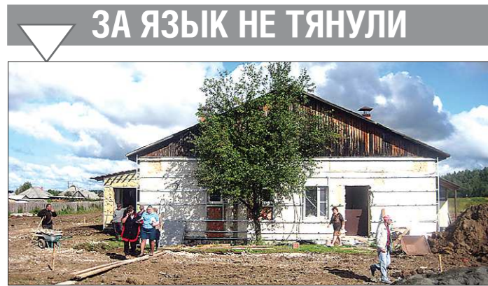
Сдачу объекта опять перенесли — теперь уже на 22 июня