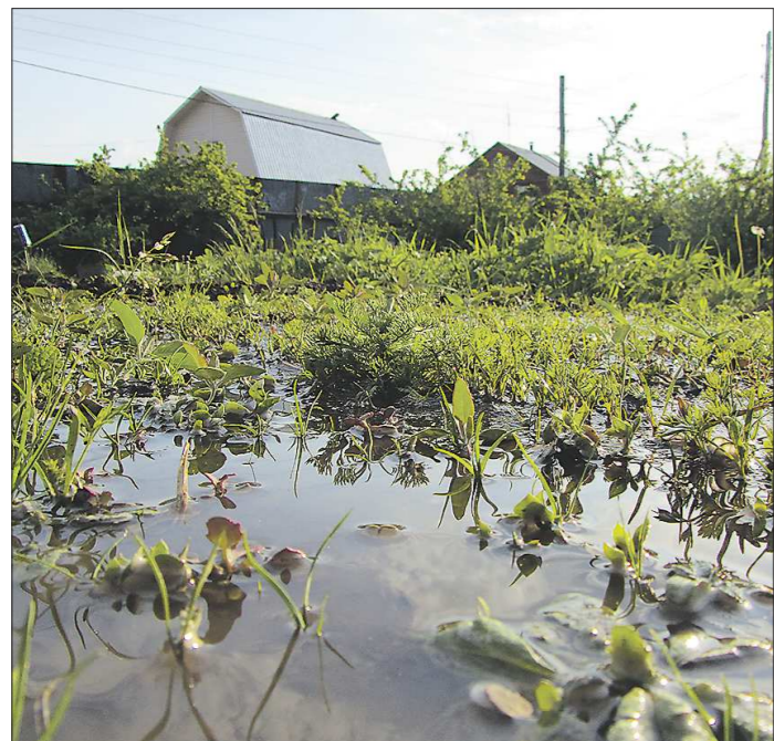
Обильные (или глубинные поливы) в сравнении с частыми поверхностными экономят количество воды, затраты времени и сил