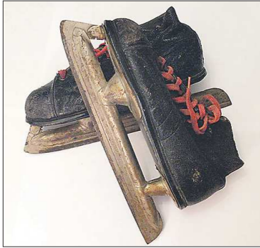
Интересно, что коньки верхотурского завода с рук можно купить и сегодня. Так, недавно на одном из популярных сайтов появилось объявление о продаже таких коньков 1952 года выпуска. Цена — 800 рублей для производства гильзы.