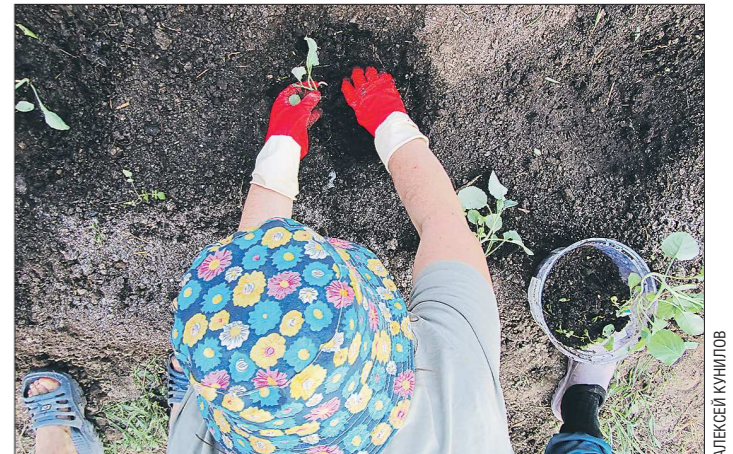
Сразу после посадки рассада капусты не требует большого количества питательных веществ

В июне капуста начинает быстро расти. Чтобы растение не завалилось и образовало дополнительные корни, его надо окучивать. Делать это надо тогда, когда стебель ещё нежный, не огрубел и на нём могут легко образоваться дополнительные корни.