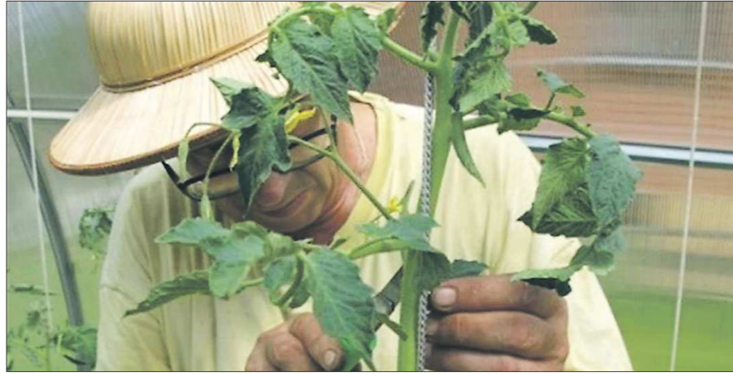
Формирование растений в один стебель позволяет получить ранний, а загущенная посадка — максимальный урожай с единицы площади

Супердетерминантные сорта формируют на основном стебле всего два-три соцветия, расположенных через один лист или друг за другом, а потом их рост надолго прекращается. Все побеги про-