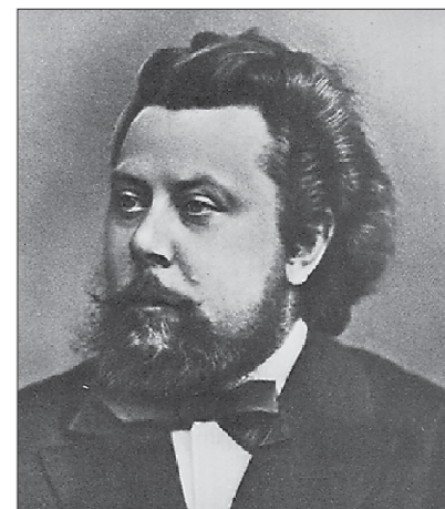
Модест Мусоргский родился 21 марта 1839 года в селе Кареве Псковской губернии, прожил 42 года. Его самые известные произведения — это оперы «Борис Годунов» и «Хованщина»

Назвать старейший музыкальный вуз Урала и Сибири его именем было решено к столетию со дня рождения великого русского композитора. Уральская государственная консерватория (УГК) до сих пор остаётся единственным в России музыкальным вузом его имени. Уральская консерватория была основана в 1934 году. Для учебного заведения было выделено одно из самых примечательных зданий в центре города — памятник архитектуры, первый каменный дом Екатеринбурга. Ещё в 1723 году на этом месте стояла побелённая известью «мазанка», в которой находилась горная канцелярия и работали основатели города Василий Татизев и Вильгельм де Геннин, а в советское время в этом доме располагались управления тяжёлой и лёгкой промышленности Урала.