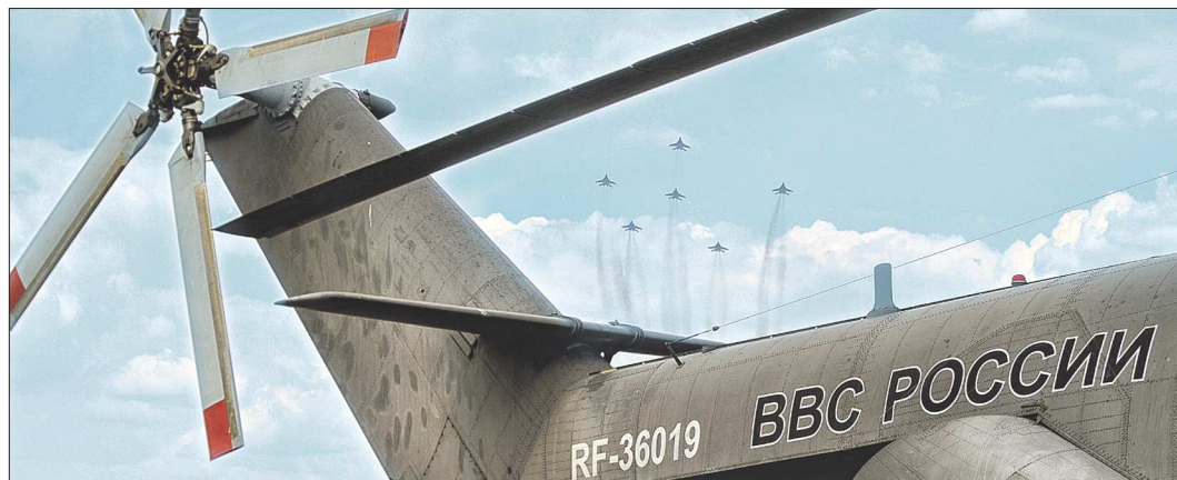
«Стрижи» на фоне самого большого российского вертолёта Ми-26