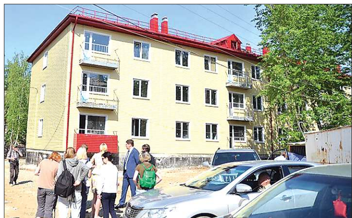
На встречу с жителями свердловский премьер приехал сразу после осмотра строящегося дома для переселенцев из аварийного жилья, по которому у краснотуринцев тоже были вопросы. Месяц назад нерадивого подрядчика сменили. У новых строителей остался месяц, чтобы сдать объект