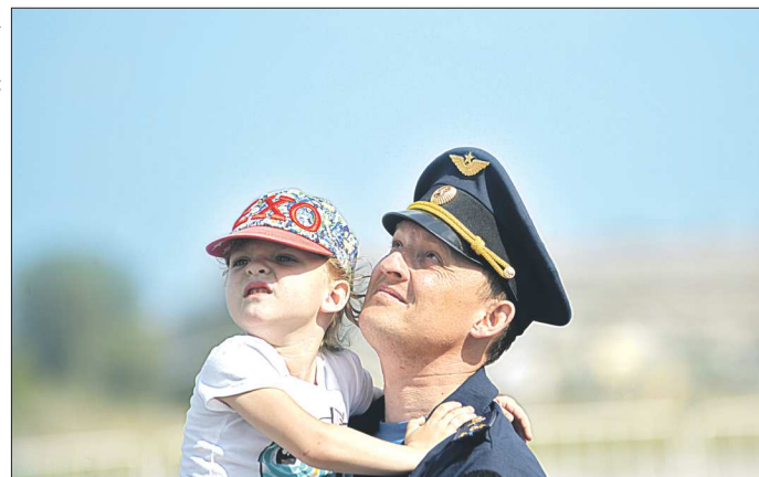
Вот так и приходит мечта – стать лётчиком