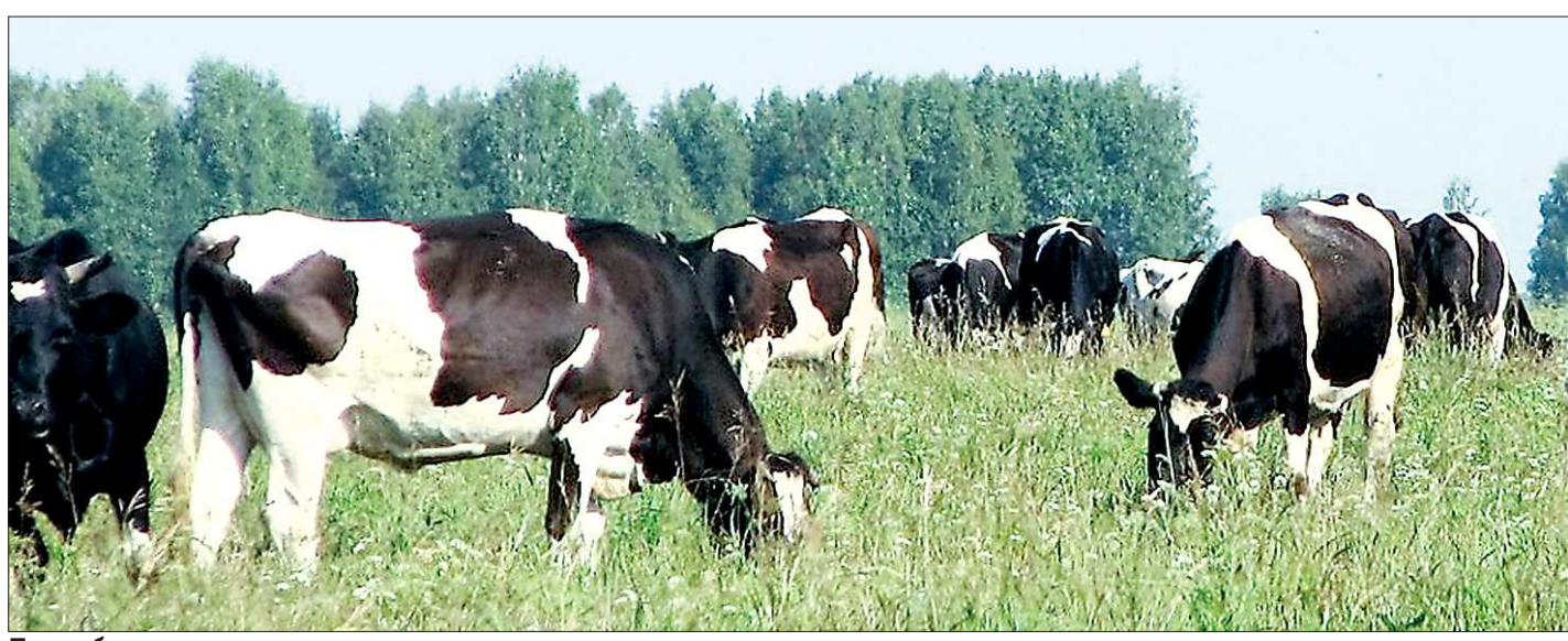
Путь к большому молоку начинается в поле

Также отмечу, что в последние два месяца при подаче судебного иска о банкротстве юриц нас опережают контрагенты предприятия. Получает распространение одна из схем ухода от налогообложения, когда должник договаривается со своей дружественной компанией, чтобы та подала на него иск о банкротстве. Дело в том, что истец имеет право выбрать своего конкурсного управляющего, который будет контролировать всю процедуру банкротства и с которым проще договориться. Мы пытаемся оспаривать в суде такие долги и доказывать, что они фиктивные. Практика судебных решений по этим делам — пятьдесят на пятьдесят.