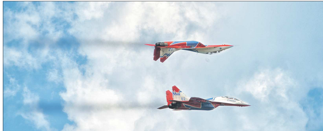
Такой «бутерброд» могут осилить только асы