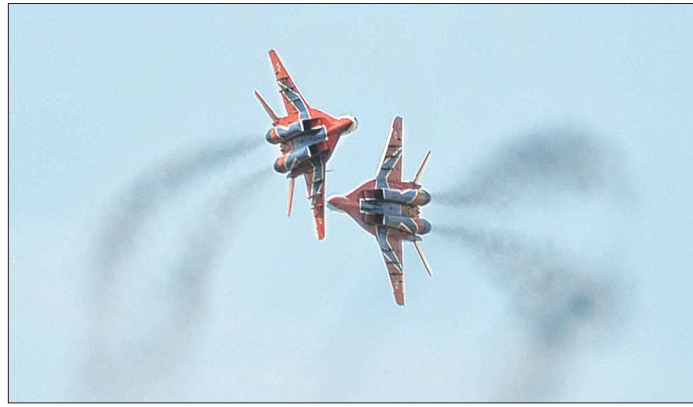
Манёвр пересечения самолётов с параллельных курсов исполнялся по команде с земли на счёт «раз-два-три»