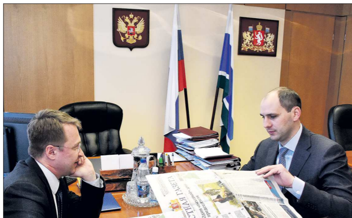
Приходя на интервью к Денису Паслеру, мы не договариваемся о вопросах

— Это не связанные вещи. Налоговое законодательство поменялось несколько лет назад. Сегодня предприятия платят налоги по месту нахождения. То есть если де факто они находятся здесь, то налог на имущество, налог на землю, НДФЛ они обязаны платить здесь. Поэтому инвестировать, конечно, стоит. Потому что на-