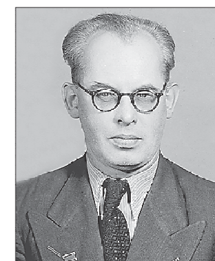
В Заречном Пётр Алешенков жил с 1962 по 1967 год

В 2011 году часть улицы Алешенкова преобразовали в бульвар — провели реконструкцию, высадили цветы и деревья. Всё это было сделано на средства, перечисленные на социальное развитие городского округа Заречный в связи с сооружением четвёртого энергоблока электростанции.