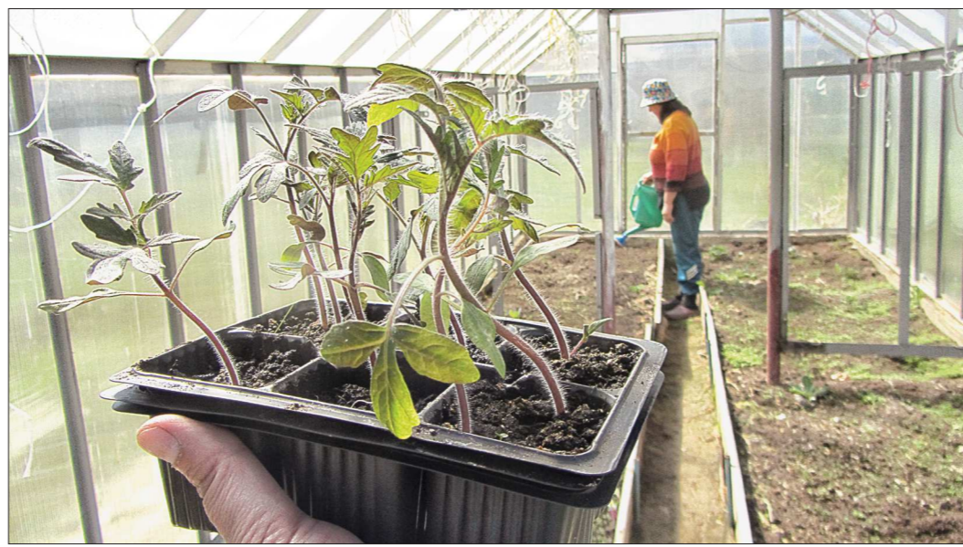
В Свердловской области, с учётом членов семей, около двух миллионов садоводов. И почти на каждом участке – теплица

— Если мы выращиваем огурцы, то в теплице нужно создать, образно говоря, болото. Чтобы почва была хорошо пролита, воздух был тёплым и влажным. Ведь огурец – это же лиана, которая пришла к нам из Индии, из джунглей. Поэтому нам необходимо сделать так, чтобы в нашей теплице было не сухо, а влажно. А вот лучшая теплица для томата – это, как я выражаюсь, теплица без крыши. У неё бока закрыты поликарбонатом, а крыша затянута плёнкой. До 15 июня у нас теплица закрыта крышей, после 15 июня и до 15 июля мы эту крышу убираем. Потому что у томата, в отличие от огурца, если в теплице температура воздуха выше плюс 33 градусов, то пыльца теряет фер-