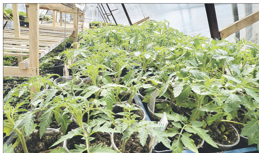
Для помидорной рассады достаточно всего месяца роста в теплице, чтобы быть готовой к пересадке на постоянное место

ят зимние теплицы, у них круглый год на столе своя зелень и овощи. Но можно не всю зиму топить теплицы, а только весной и осенью. Даже простые палки позволяют на две недели раньше высаживать растения. Некоторые ставят электрообогреватели, тепловые пушки. С их помощью, как правило, поднимают ночную температуру, чтобы не было сильных её перепадов. Те, кто не прожигают на даче постоянно, прокладывают в теплице специальный греющий кабель, устанавливают терморегуляторы, датчики, подвешивают светодиодные лампы для досвечивания растений, монтируют устройства автоматического проветривания, подачи питательных растворов. Это уже – теплицы 21 века, в которых умные устройства помогают нам ухаживать за растениями.