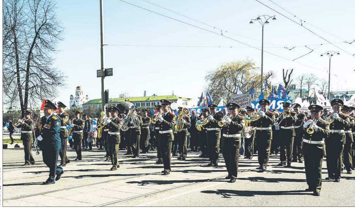
Традиционная Первомайская демонстрация в центре Екатеринбурга. Колонна дошла до площади 1905 года, где начался митинг. Участие в шествии приняли более 20 тысяч человек: члены профсоюзов, сотрудники предприятий, активисты политических партий. Во главе колонны был духовой оркестр