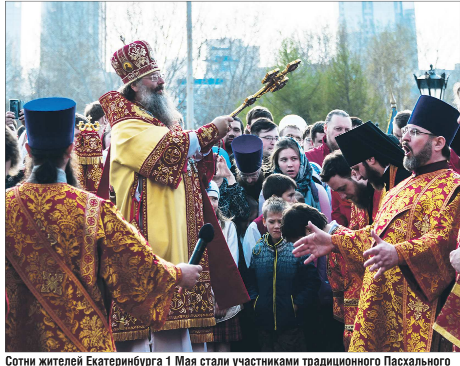
Сотни жителей Екатеринбурга 1 Мая стали участниками традиционного Пасхального крестного хода. Горожане прошли от Свято-Троицкого кафедрального собора до Храма-на-Крови. Праздничное шествие возглавил митрополит Екатеринбургский и Верхотурский Кирилл