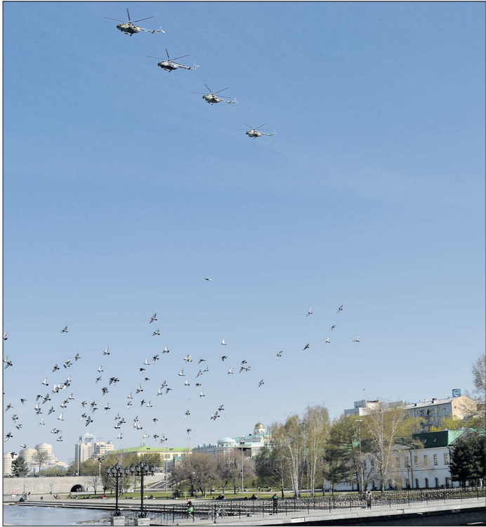
Вчера над центром Екатеринбурга пролетели военные самолёты и вертолёты: их экипажи отработали прохождение парадным строем перед 9 Мая