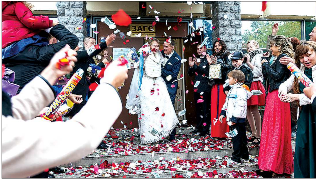
За неимением собственных ЗАГСов жители близлежащих к Екатеринбургу городов предпочитают проводить свадьбы в ЗАГСах уральской столицы. Здесь их принимают вне зависимости от прописки

Всего в Свердловской области работают 64 ЗАГСа. Из них семь в Екатеринбурге и три в Нижнем Тагиле. К слову, в Каменске-Уральском, который по численности населения лишь в два раза меньше Нижнего Тагила, ЗАГС только один, а за ним закреплён ещё и Каменский ГО. — ЗАГС — это территориально-исполнительный орган государственной власти, и формируется он в соответствии с тем административно-территориальным делением, которое было раньше — объяснила корреспонденту «ОГ» начальник управления ЗАГСов Свердловской области Татьяна Кузнецова. — К одному административному центру могут относиться сразу несколько муниципалитетов, например, Среднеуральск и Верхняя Пышма относятся к административ-